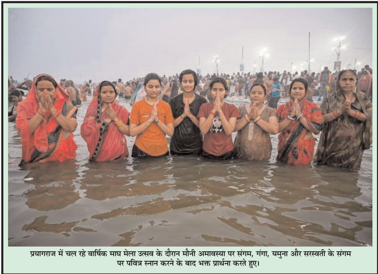
प्रयागराज में चल रहे वार्षिक माघ मेला उत्सव के दौरान मौनी अमावस्या पर संगम, गंगा, यमुना और सरस्वती के संगम पर पवित्र स्नान करने के बाद भक्त प्रार्थना करते हुए।

इधर लालू को लेकर हाई कोर्ट ने पिछली सुनवाई में बड़ी बात कही। अदालत ने कहा कि कोर्ट की बिना जानकारी में उन्हें एम्स, दिल्ली कैसे भेज दिया गया। सबसे पहले उनकी मेडिकल रिपोर्ट कोर्ट में पेश की जानी थी। उनको क्या बीमारी है, यह देखने के बाद ही मेडिकल बोर्ड के दिल्ली भेजने के फैसले की परख की जा सकती है। रिम्म डायरेक्टर के कोर्ट में मेडिकल रिपोर्ट नहीं दाखिल करने ने अदालत ने शौ-कांज नोटिस भी जारी किया है।