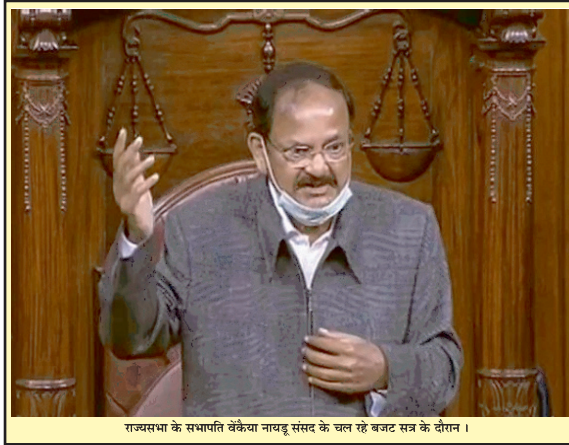
राज्यसभा के सभापति वैकेया नायडू संसद के चल रहे बजट सत्र के दौरान ।

विभिन्न स्तरों पर चीन के साथ हुई वार्ता के दौरान भारत ने चीन को बताया कि वह तीन सिद्धांतों के आधार पर इस समस्या का समाधान चाहता है। उन्होंने कहा कि पहला, दोनों पक्षों द्वारा वास्तविक नियंत्रण रेखा (एलएसी) को माना जाए और उसका सम्मान किया जाए। दूसरा, उन्होंने कहा, हम अपनी एक इंच बदलने का एकतरफा प्रयास नहीं किया जाए। तीसरा, सभी समझौतों का दोनों पक्षों द्वारा पूर्ण रूप से पालन किया जाए।