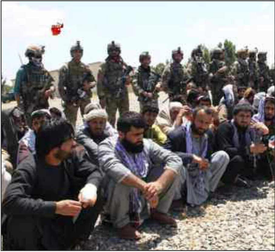
अफगानिस्तान के बगलाम प्रांत में सेना ने तालिबान के एक हिरासत केन्द्र पर कब्जा कर उसमें बंधक बनाकर रखे गये 62 लोगों को रिहा कराया।