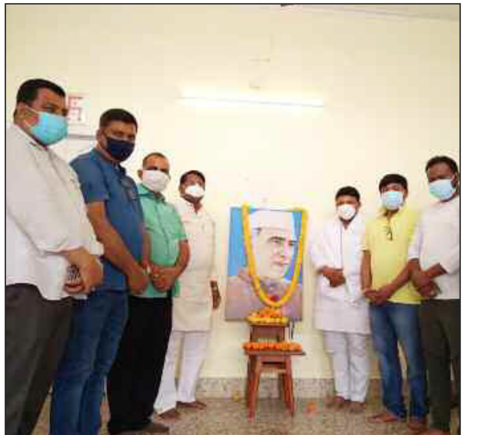
रांची। पं. नेहरू को प्रदेश कांग्रेस अध्यक्ष समेत अन्य नेताओं ने दी श्रद्धाजलि।

(ईटीसी) के विस्तार को ध्यान में रखते हुए, अगले 10 वर्षों के लिए यातायात संबंधी अनुमानों के अनुरूप आने वाले टोल प्लाजा पर एक नये डिजाइन और ढांचा बनाने पर जोर दिया गया है, ताकि प्रभावी टोल प्लाजा कलेक्शन सिस्टम लाया जा सके। जैसा कि सोशल डिस्टेंसिंग का पालन अब सामान्य नियम बन गया है, ज्यादा से ज्यादा यात्री फास्टेज के इस्तेमाल का विकल्प चुन रहे हैं, इसलिए यह ड्राइवर और टोल ऑर्परेटर्स के बीच किसी भी सीधे संपर्क की संभावना को दूर करता है। हाइवे यूजर्स द्वारा फास्टेज को उपयोग करने में लगातार बढ़ोतरी होना और उसे स्वीकार किया जाना उत्साहजनक है और इससे टोल संचालन में अधिक कुशलता लाने में मदद मिली है।