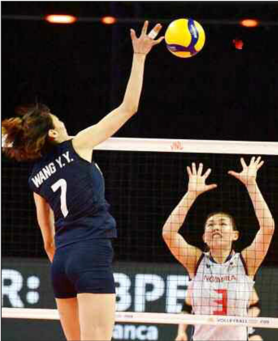
इटली में जापान और चीन के बीच वॉलीबॉल मैच खेलते हुए खिलाड़ी।