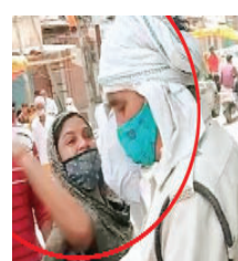
इंदौर के भूमाफिया संघवी पिता-पुत्र से थाने में घंटों पूछताछ

खंडवा। कोरोना कर्फ्यू में गुरुवार दोपहर बाइक सवार मा/बेटे को पुलिस ने चालान के लिए रोका। महिला से विवाद बढ़ गया। महिला ने पुलिस जवान को थपड़ जड़ दिया। यही नहीं, मारने के लिए चप्पल तक उठा ली। वहां मौजूद किसी ने इसका वीडियो बना लिया। दोनों पक्षों ने थाना कोतवाली जाकर आवेदन दिया है। घंटाघर क्षेत्र में एक महिला बेटे के साथ बाइक पर सवार होकर काम पर निकली। तभी पुलिस टीम ने महिला और उसके बेटे को रोक लिया। पुलिस जवान ने गाड़ी की चाबी निकाल ली। विवाद बढ़ा तो जवान ने महिला को कुछ अपशब्द कह दिए, जिसके बाद महिला आग बबूला हो गई। महिला ने होमागार्ड जवान को थपड़ मार दिए लोगों ने महिला को समझाकर शांत कराया।