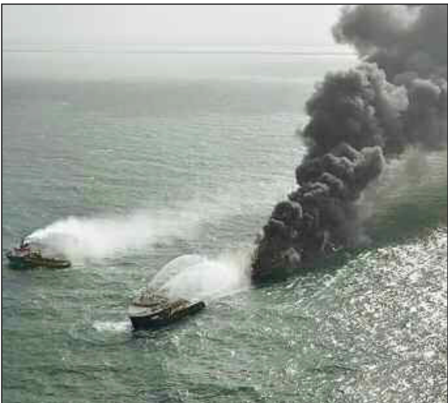
कोलंबो पोर्ट के पास श्रीलंकाई एयरफोर्स ने एक कंटेनर जहाज की तस्वीर जारी की। इस जहाज में लगी आग के बाद धुआं उठ रहा था।

लागाया कि वायरस को मात देने के छह महीने के भीतर इन मरीजों ने किन नई बीमारियों का सामना किया है। शोध से मिले आंकड़ों की तुलना ऐसे मरीजों से की गई जो कोरोना से कभी संक्रमित नहीं हुए। शोधकर्ताओं ने पाया कि कोरोना की चपेट में आने वाले 14 फीसदी मरीजों में कम से कम एक नई स्वास्थ्य समस्या देखी गई। इन स्वास्थ्य समस्याओं के कारण कोरोना मरीजों को अस्पताल का रुख भी करना पड़ा। स्वस्थ लोगों के मुकाबले कोविड-19 पर जीत हासिल करने वाले रोगियों के किसी नई बीमारी के कारण अस्पतालों में भर्ती होने की दर भी पांच फीसदी ज्यादा पाई गई है। मुख्य शोधकर्ता डॉक्टर इलेन मैक्सवेल ने बताया कि युवाओं में कोरोना से ठीक होने के बाद भी नई बीमारी का खतरा ज्यादा देखा गया है। उन्होंने कहा कि बुजुर्गों और बीमार मरीजों की तुलना में नई बीमारी से युवा ज्यादा प्रभावित दिख रहे हैं। इनमें वो मरीज भी शामिल हैं, जिन्हें पहले कभी भी सेहत संबंधी कोई परेशानी नहीं हुई थी।