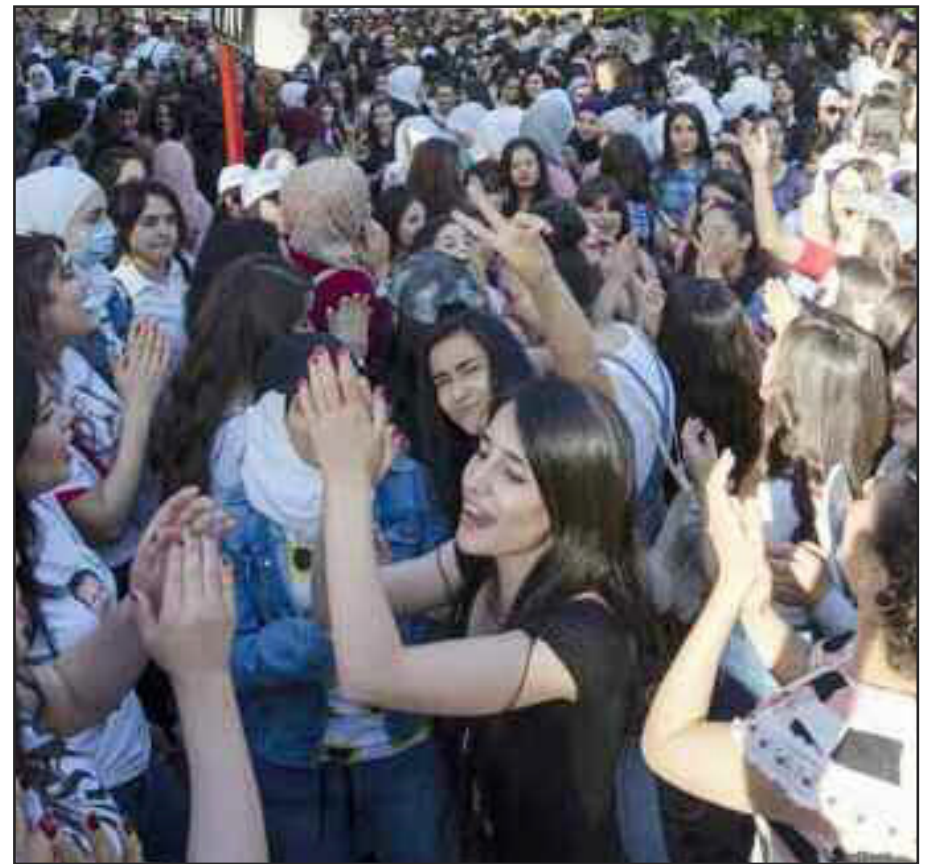
सिरिया में मतदान के लिए जाने से पहले डांस करते हुए छात्र।

इजरायल के नेता पहल से ही ईरान के साथ परमाणु समझौते में फिर से शामिल होने के बाइडन प्रशासन के प्रयासों को लेकर चिंतित हैं। इजरायल ईरान के परमाणु कार्यक्रम का लंबे समय से विरोध करता रहा है। ब्लिंकन ने यरुशलम और रामल्लाह में एक दिन में कई बैठकें कीं। इस दौरान वह बार बार हमास और इजरायल के बीच संघर्ष में नागरिकों की दुखद मौतों पर जोर देते रहे।