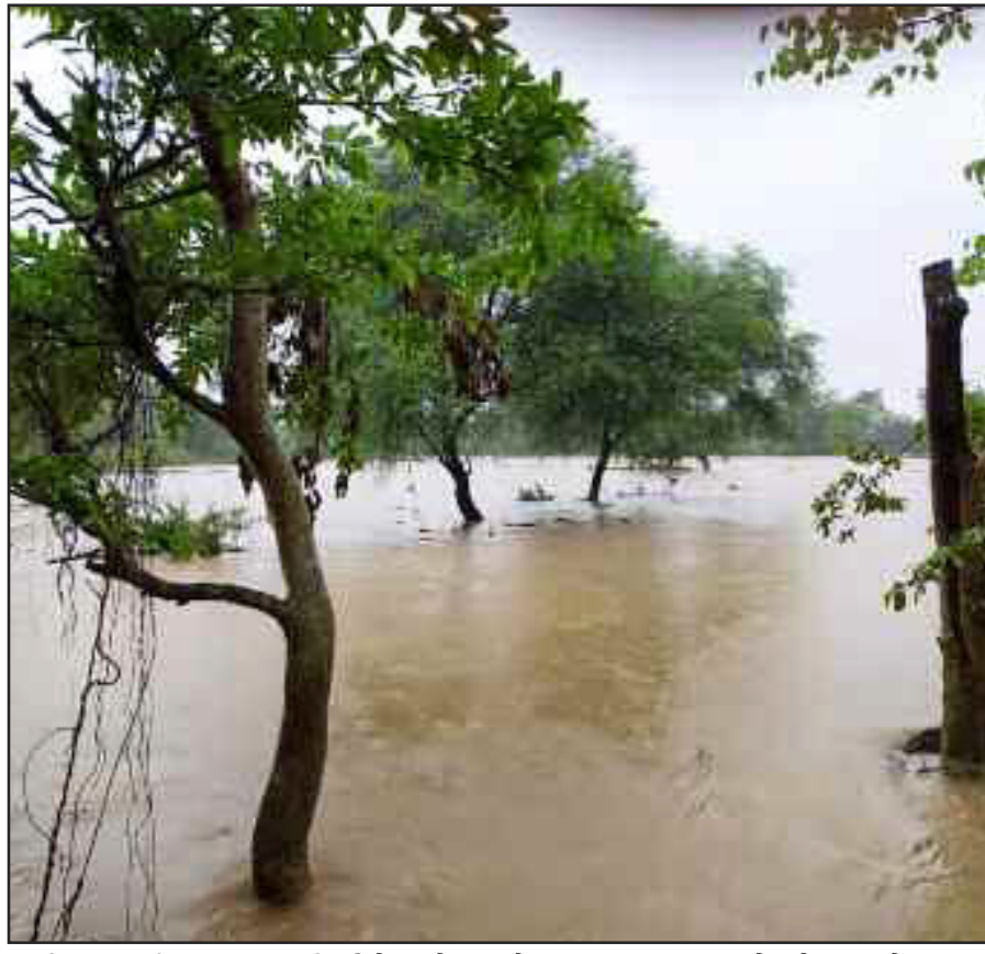
रांची। चक्रवाती तूफान यास डीप डिप्रेशन के रूप में झारखंड पहुंचा, कमजोर होकर आगे बढ़ा।