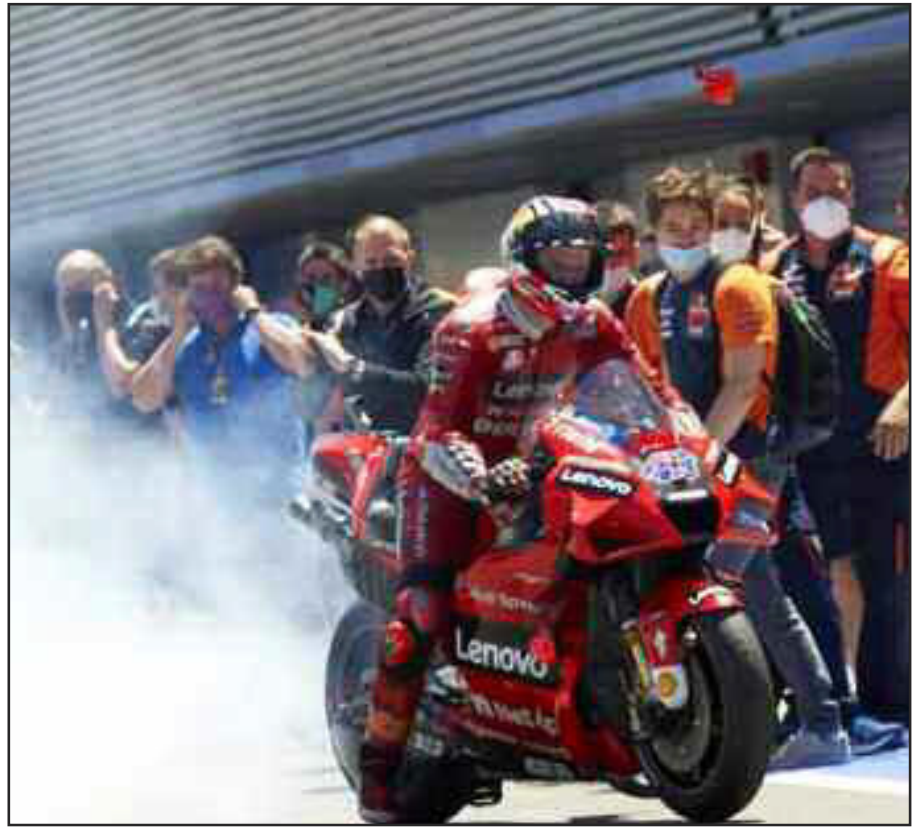
स्पेन में मोटो जीपी रेस में जीत के बाद उत्साहित ऑस्ट्रेलियाई राइडर जैव मिलर को देखते हुए दर्शकों का एक समूह।