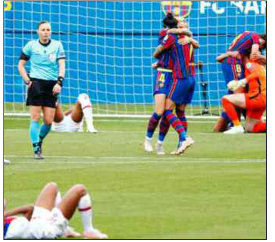
वार्सिलोना (स्पेन) में पेरिस सेंट जर्मेन क्लब को हराने के बाद उत्साहित एफ सी वार्सिलोना क्लब की खिलाड़ी।

सनराइजर्स हैदराबाद : केन विलियमसन (कप्तान), डेविड वार्नर, जॉनी बेयरस्टो, मनीष पांडे, श्रीवत्स गोस्वामी, रिद्धिमान साहा, प्रियम गर्ग, विजय शंकर, अभिषेक शर्मा, अब्दुल समद, विराट सिंह, जेसन होल्डर, मोहम्मद नबी, राशिद खान, शाहबाज नदीम, भुवनेश्वर कुमार, संदीप शर्मा, खलील अहमद, सिद्धार्थ कौल, बासिल थम्पी, जगदीश सुचित, केदार जाधव और मुजीब उर रहमान।