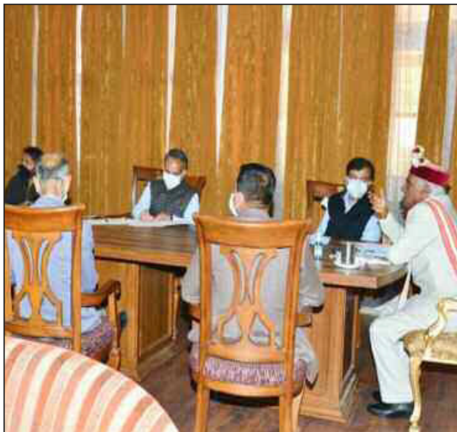
शिमला। राज्यपाल ने कुलपतियों से कोविड के विरुद्ध लड़ाई में सहयोग का आह्वान किया।

अप्रैल 2021 की कर अवधियों (मासिक रिटर्न दाखिल करने वाले करदाताओं के लिए), जो क्रमशः अप्रैल 2021 और मई 2021 में देय हैं, के लिए और जनवरी-मार्च 2021 की अवधि (क्यूआरएमपी योजना के तहत त्रैमासिक रिटर्न दाखिल करने वाले करदाताओं के लिए), जो अप्रैल 2021 में देय हैं, के लिए अंतिम तिथि के बाद फॉर्म जीएसटीआर-3बी में जमा किए गए रिटर्न के संबंध में विलंब शुल्क को 30 दिनों के लिए माफ कर दिया गया है। जीएसटीआर-1, आईएफएफ, जीएसटीआर-4 और आईटीसी-04 दाखिल करने की अंतिम तिथि बढ़ाई गई है। अप्रैल महीने के लिए फॉर्म जीएसटीआर-1 और आईएफएफ दाखिल करने की अंतिम तारीख (मई में निर्दिष्ट) 15 दिन बढ़ा दी गई है। वित्त वर्ष 2020-21 के लिए फॉर्म जीएसटीआर-4 दाखिल करने की अंतिम तिथि 30 अप्रैल, 2021 से बढ़ाकर 31 मई, 2021 कर दी गई है। इसके अलावा जनवरी-मार्च, 2021 की तिमाही के लिए फॉर्म आईटीसी-04 दाखिल करने की अंतिम तिथि 25 अप्रैल, 2021 से बढ़ाकर 31 मई, 2021 कर दी गई है।