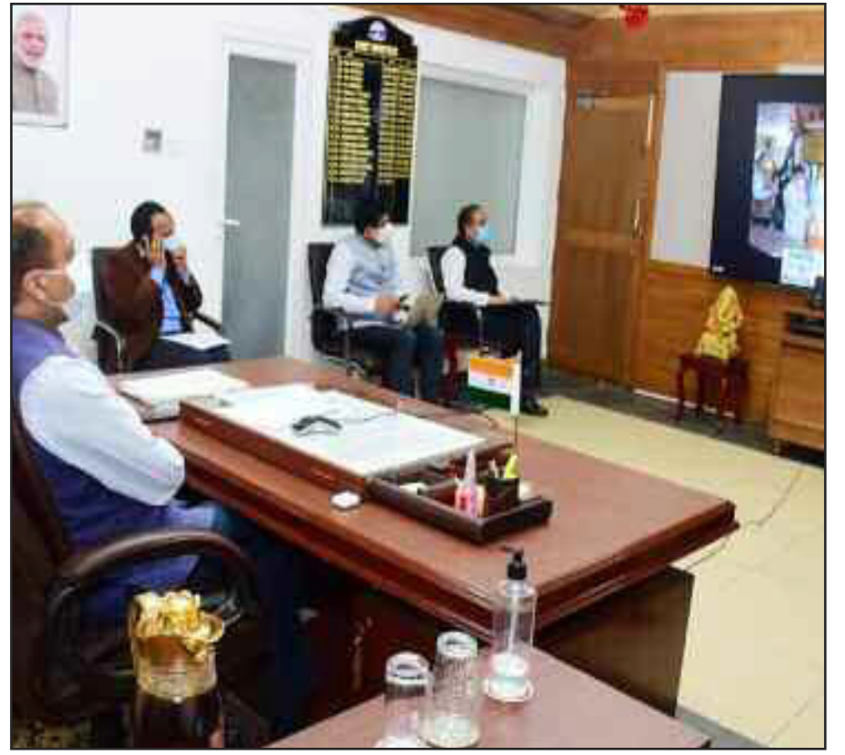
शिमला। मुख्यमंत्री ने सिराज विधानसभा क्षेत्र के वालीचैकी के लिए 14.36 करोड़ रुपये की विकासवात्मक परियोजनाओं की आधारशिला रखी।

प्रतिशत है। हालांकि दूसरी डोज लेने वालों की संख्या काफी कम है। यह सिर्फ दो प्रतिशत है। पूनावाला ने कहा कि राजनेताओं और आलोचकों ने टीके की कमी के लिए एसआईआई को दोषी ठहराया है, लेकिन वैक्सीन नीति सरकार द्वारा बनाई गई थी। आपको बता दें कि भारत में टीकाकरण अभियान की शुरुआत 16 जनवरी को हुई थी। केंद्र सरकार ने शुरू में रकम से 2.1 करोड़ टीके मंगवाए थे। मार्च में जब मामले बढ़ने लगे तो अतिरिक्त 11 करोड़ डोज का ऑर्डर दिया गया था। विस्तारित टीकाकरण अभियान के लिए राज्यों और निजी अस्पतालों से अधिक कीमत वसूलने के लिए भी कंपनी की आलोचना की गई है। सीरम ने बाद में राज्य सरकारों द्वारा भुगतान की जाने वाली कीमत को 400 रुपये से घटाकर 300 रुपये कर दिया था।