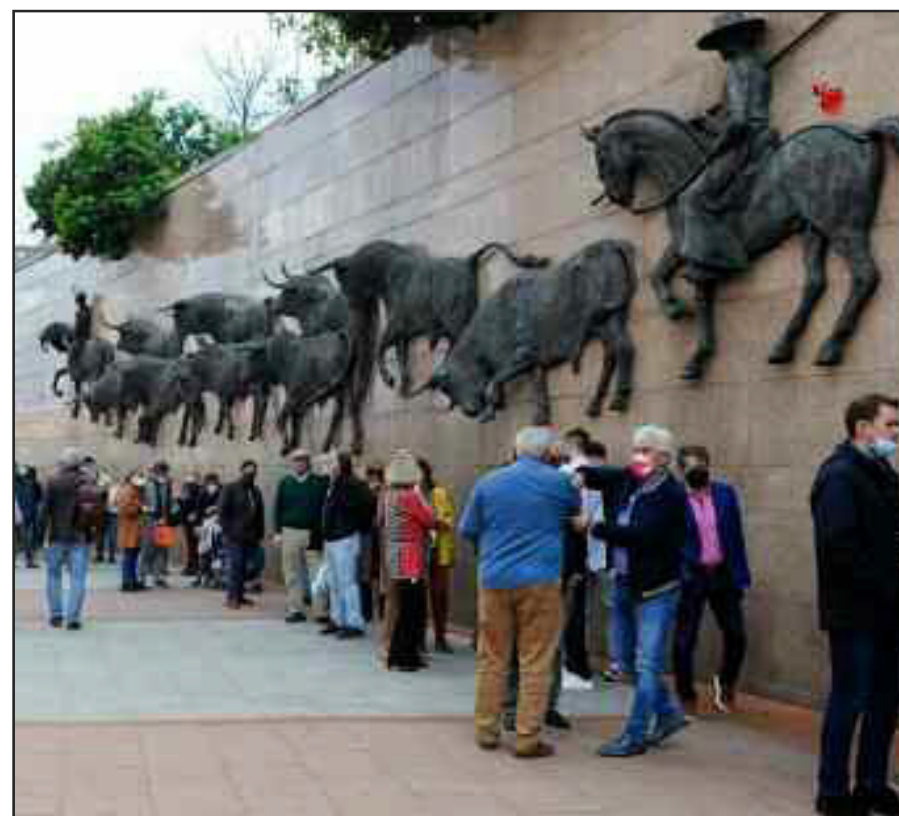
मैड्रिड में लास वेंटस के बुलरिंग में प्रवेश करते हुए लोग। यहां साल 2019 के बाद हुई पहली बुलफाइट में करीब छह हजार दर्शक शामिल हुए।

पोस्ट में एक तरफ चीन के रॉकेट लॉन्च करने और दूसरी तरफ भारत में लाशों के जलाए जाने की तस्वीर को दिखाया गया है। इस पोस्ट में कैप्शन लिखा है, चीन में आग जलाना बनाम भारत में आग जलाना। इस पोस्ट पर चीन के सोशल मीडिया यूजर्स ने बहुत तीखी प्रतिक्रिया दी और कम्युनिस्ट पार्टी की भारत में कोरोना त्रासदी के प्रति असंवेदनशीलता दिखाने के लिए कड़ी आलोचना की। वीबो यूजर्स ने कहा कि यह पोस्ट अनुचित है और चीन को भारत के साथ सहानुभूति दिखानी चाहिए। इस आलोचना के बाद चीन के सरकारी भोपू ग्लोबल टाइम्स के एडिटर हू शिजिन ने लिखा कि हमें भारत के लिए मानवीयता के परिचम को इस बार ऊपर उठाना चाहिए।