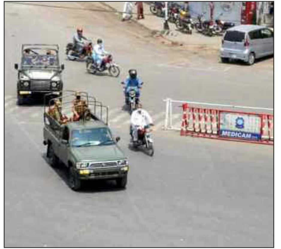
पाकिस्तान के लाहौर शहर में कोरोना वायरस की रोकथाम के लिए लगे लॉकडाउन के दौरान एक सड़क पर गश्त करते हुए सैनिक।

इस देश में जनवरी में लोग टीका और साइट इफेक्ट की खबरों से संशय में थे। 40 फीसदी आबादी ही इसके लिए तैयार थी। लेकिन टीके के सकारात्मक प्रभाव के बाद लोगों की सोच में बदलाव आया है। हालिया सर्वे के मुताबिक 76 फीसदी आबादी मानती है कि सरकार और लोगों की पहली प्राथमिकता टीका होना चाहिए। हालांकि, टीके की कमी की वजह से यह देश संघर्ष कर रहा है। सरकार का कहना है कि टीके की आपूर्ति होते ही हम बड़े पैमाने पर सेंटर बनाएंगे ताकि कोई भी व्यक्ति इससे न छूटे। यह हमारी पहली प्राथमिकता है।