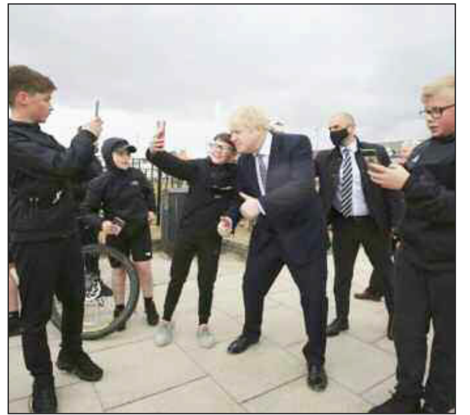
इंग्लैंड में कंजरवेटिव पार्टी उम्मीदवार के पक्ष में प्रचार के दौरान सेल्फी खिंचाते हुए ब्रिटेन के बोरिस जोसंस।

डॉ. फाउची ने कहा कि चीन में जब पिछले साल गंभीर समस्या थी, तो उसने अपनी संसाधनों को बहुत तेजी से नए अस्पताल बनाने में जुटा दिया था ताकि वह उन सभी लोगों को अस्पताल मुहैया करा सके, जिन्हें भर्ती किए जाने की आवश्यकता है। उन्होंने मीडिया रिपोर्ट के हवाले से कहा कि अस्पताल में बिस्तरों की गंभीर कमी है और अस्थायी व्यवस्थाओं में लोगों की देखभाल की जा रही है। सात अमेरिकी राष्ट्रपतियों के साथ काम कर चुके डॉ. फाउची ने सुझाव दिया कि भारत को अपनी सेना की मदद से उसी तरह फोल्ड अस्पताल बनाने चाहिए, जैसे कि युद्ध के दौरान बनाए जाते हैं ताकि उन लोगों को अस्पताल में बिस्तर मिल सके, जो बीमार हैं और जिन्हें भर्ती किए जाने की आवश्यकता है। उन्होंने कहा कि भारत सरकार संभवतः यह पहले ही कर रही है।