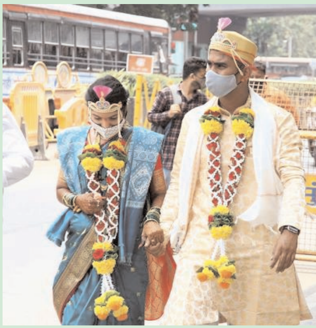
मुंबई में शादी समारोहों पर प्रतिबंध के कारण, बांद्रा कोर्ट में अपनी शादी के पंजीकरण के बाद दूल्हा और दुल्हन बाहर आते हुए।