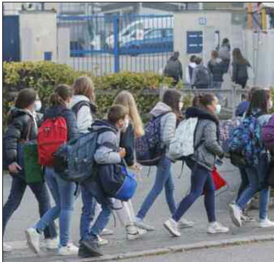
फ्रांस में स्कूल खुलने के बाद एक स्कूल में कतार लगाकर जाते हुए बच्चे।

फ्रांस ने अभी इस सौदे पर कोई बयान नहीं दिया है। फ्रांस वर्ष 2013 से 2017 के बीच मिस्त्र का सबसे बड़ा हथियार आपूर्तिकर्ता देश रहा था। मिस्त्र और फ्रांस के बीच सेना के पूर्व जनरल अल सीसी के सल्ला में आने के बाद बहुत घनिष्ठ संबंध रहा है। दोनों ही का पश्चिम एशिया में हित मिलते हैं। यही नहीं तुर्की के राष्ट्रपति एर्दोगान के संदिग्ध रुख के खिलाफ मिस्त्र और फ्रांस एक समान राय रखते हैं।