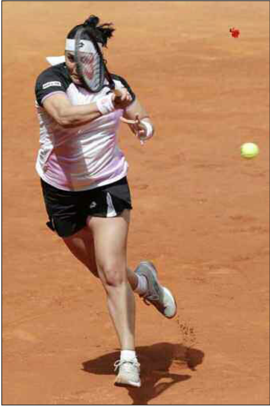
मैट्रिड में ट्यूनीशिया के ओनस जेबियूर स्विटजरलैंड के बेलिंडा बेनसिस की ओर रिटर्न शॉट खेलते हुए।

जिन चार खिलाड़ियों को द हण्ड्रेड में खेलने की अनुमति दी गयी है, उनमें हरमनप्रीत कौर, स्मृति मंधाना, जेमिमा रोड्रिगिज और दीप्ति कुमारी भी शामिल हैं। वहीं महिला मुकाबले के लिए 24 विदेशी खिलाड़ियों का करार होना है, जिसमें 20 का करार हो गया है। इन 20 में 11 ऑस्ट्रेलियाई खिलाड़ी शामिल हैं। मार्च में दक्षिण अफ्रीका के खिलाफ खेले घरेलू टी20 सीरीज के दौरान मंधाना, भारतीय टीम की उप-कप्तान थीं। महिलाओं में कोई प्लेयर ड्राफ्ट नहीं होगा। टीम का चयन उनके मुख्य कोच करेंगे। हर टीम ज्यादा से ज्यादा इंग्लैंड के केन्द्रीय अनुबंध के तीन खिलाड़ियों को शामिल कर सकती है।