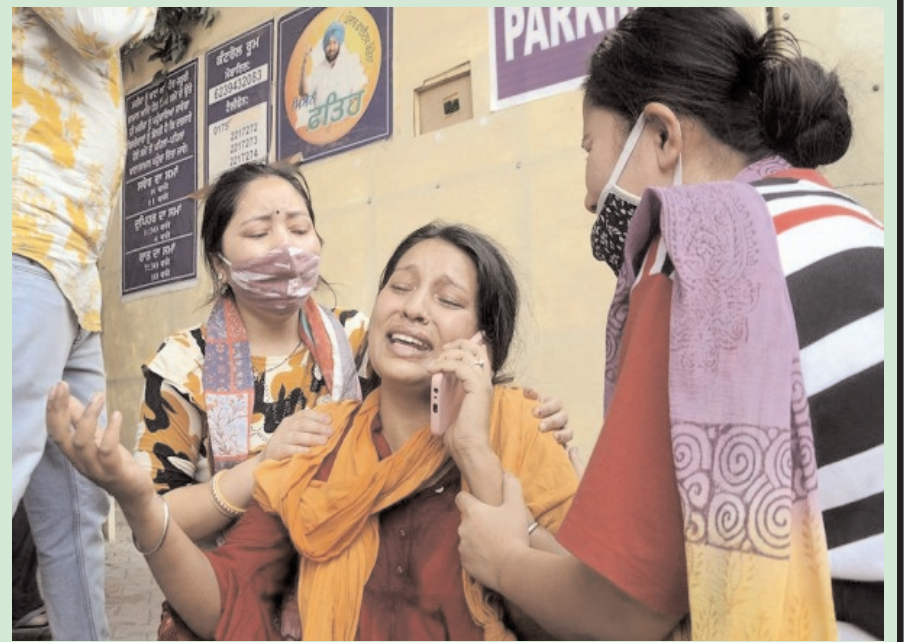
पटियाला के एक सरकारी अस्पताल में कोविड-19 की वजह से परिवार के सदस्य की मौत पर रोते बिलखते परिवार के लोग।