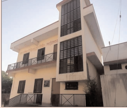
सेंटर में नौ कैदी भर्ती थे और सभी कोरोना पीड़ित थे। एक अन्य कैदी के जरिए ही पुलिस को पांच कैदियों के

सोमवार रात उनके घरों पर पुलिस ने दबिश दी थी। उल्लेखनीय है कि सोमवार सुबह पांचों कैदी कोविड केयर सेंटर के छत का दरवाजा तोड़कर भाग निकले थे। इस