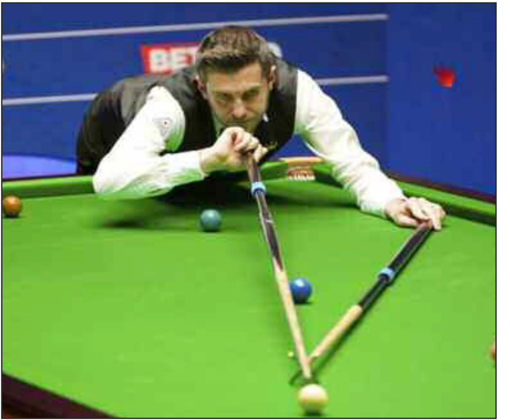
इंग्लैंड में मार्क सेल्बी विश्व स्नूकर चैम्पियनशिप में खेलते हुए।

शेफील्ड, (एजेंसी)। मार्क सेल्बी ने चौथी बार विश्व स्नूकर खिताब जीता है। सेल्बी ने दर्शकों से भरे क्रिसबल थियेटर में हुए फाइनल में शॉन मर्फी को 18-15 से हराकर यह विश्व चैम्पियनशिप अपने नाम की है। सेल्बी से पहले केवल स्टीफन हेंड्री (सात), रोनी ओ सुलिवान, रे रीयर्डन और स्टीव डेविस (छह) ने उनसे अधिक खिताब जीते हैं। सेल्बी इससे पहले 2014, 2016 और 2017 में भी विश्व चैम्पियन बने थे। सेल्बी को पिछले साल सेमीफाइनल में ओ सुलिवान के हाथों हार का सामना करना पड़ा था। इस 27 दिन के विश्व कप टूर्नामेंट से इंग्लैंड में क्वारंटाइन में एक बार फिर बड़ी संख्या में दर्शकों की वापसी हुई है। कोरोना महामारी के कारण पिछले एक साल से दर्शक स्टेडियम में नहीं आ रहे थे पर अब पाबंदियां घटने के कारण उन्हें स्टेडियम आने की अनुमति मिल गयी है।