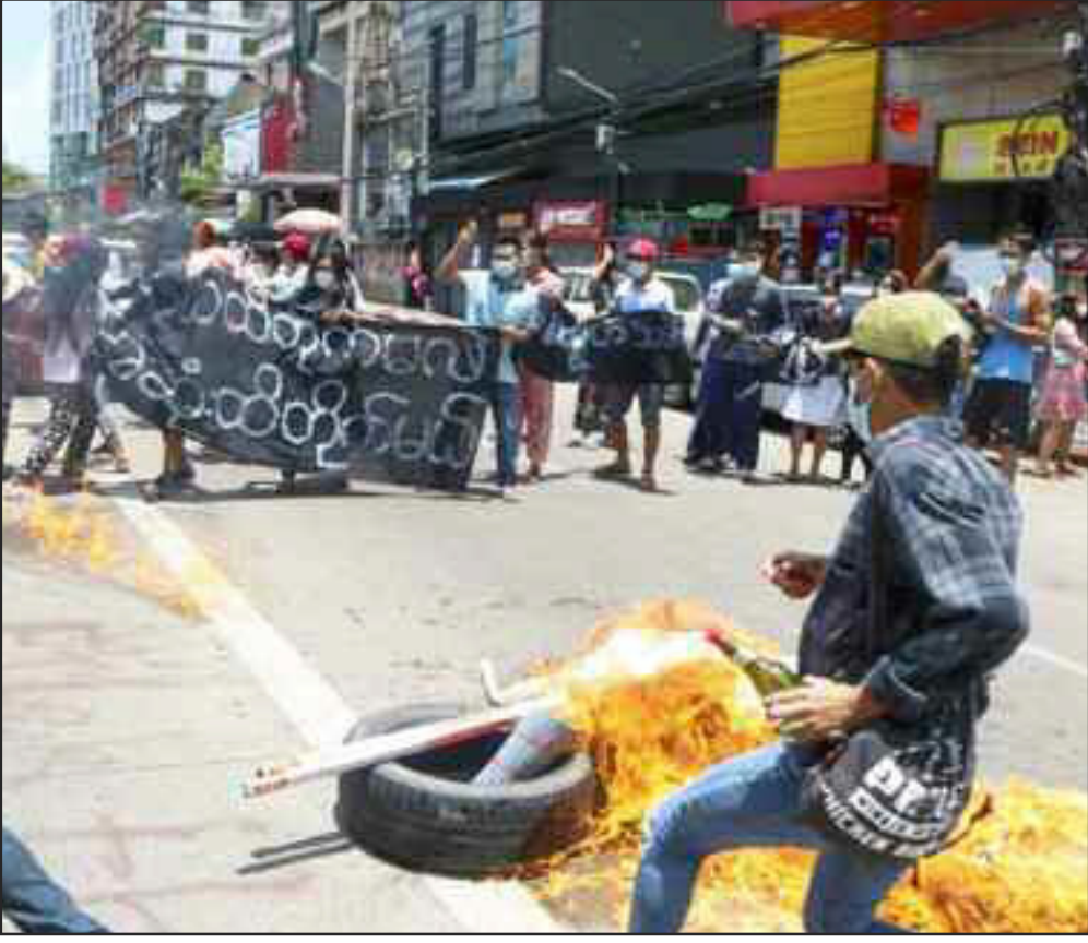
यंगून में सैन्य शासन के खिलाफ विरोध प्रदर्शन के दौरान टायर जलाते और नारे लगाते हुए लोग।