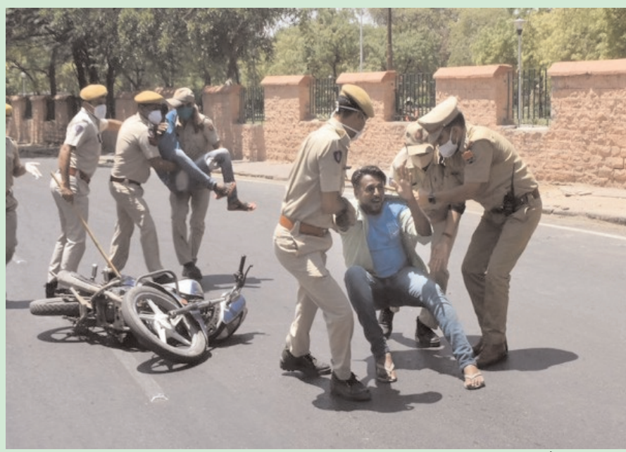
जोधपुर में कोरोनावायरस में स्याइक को नियंत्रित करने के लिए लगाए गए कर्फ्यू के दौरान पुलिस ने नियम तोड़ने वालों को पकड़ती हुई।