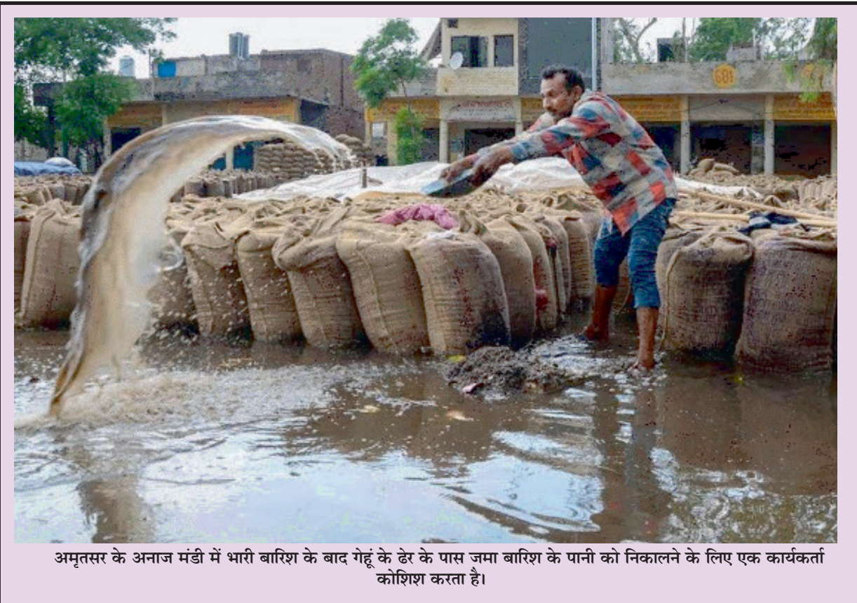
अमृतसर के अनाज मंडी में भारी बारिश के बाद गेहूँ के ढेर के पास जमा बारिश के पानी को निकालने के लिए एक कार्यकर्ता कोशिश करता है।

ऑक्सीजन की कमी की वजह से 24 मरीजों के मारे जाने को राहुल गांधी ने हत्या करार दिया था। बता दें कि इस बीच मंगलवार को भारत में कोरोना वायरस के 3 लाख 57 हजार 229 नए मामले दर्ज किए गए हैं। हालांकि, देश में कोरोना के कुल संक्रमितों का आंकड़ा 2 करोड़ के पार हो गया है। वहीं, इस दौरान 3 हजार 449 लोगों ने कोरोना की वजह से दम तोड़ दिया है।