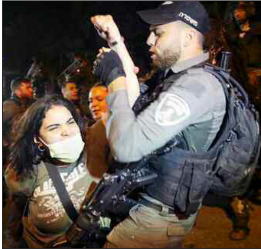
जेरुसलम में एक फिलिस्तीनी महिला और एक इजरायली पुलिसकर्मी आपस में भिड़ गये।

पुनर्विचार) अध्यादेश 2020 लागू किया ताकि जाधव वैधानिक उपाय पा सके। उन्होंने कहा कि भारत सरकार जानबूझ कर अदालत की सुनवाई में शामिल नहीं हुई और पाकिस्तान की एक अदालत के समक्ष मुकदमे पर आपत्ति जता रही है तथा उसने आईएचसी की सुनवाई के लिए वकील नियुक्त करने से भी इनकार करते हुए कहा कि यह संप्रभु अधिकारों का आत्मसमर्पण करने के समान है। मामले की सुनवाई 15 जून तक के लिए स्थगित कर दी गई है। गौरतलब है कि भारतीय नौसेना के सेवानिवृत्त अधिकारी जाधव (51) को पाकिस्तान की एक सैन्य अदालत ने जासूसी और आतंकवादी गतिविधियों के आरोपों में अप्रैल 2017 में मौत की सजा सुनाई थी।