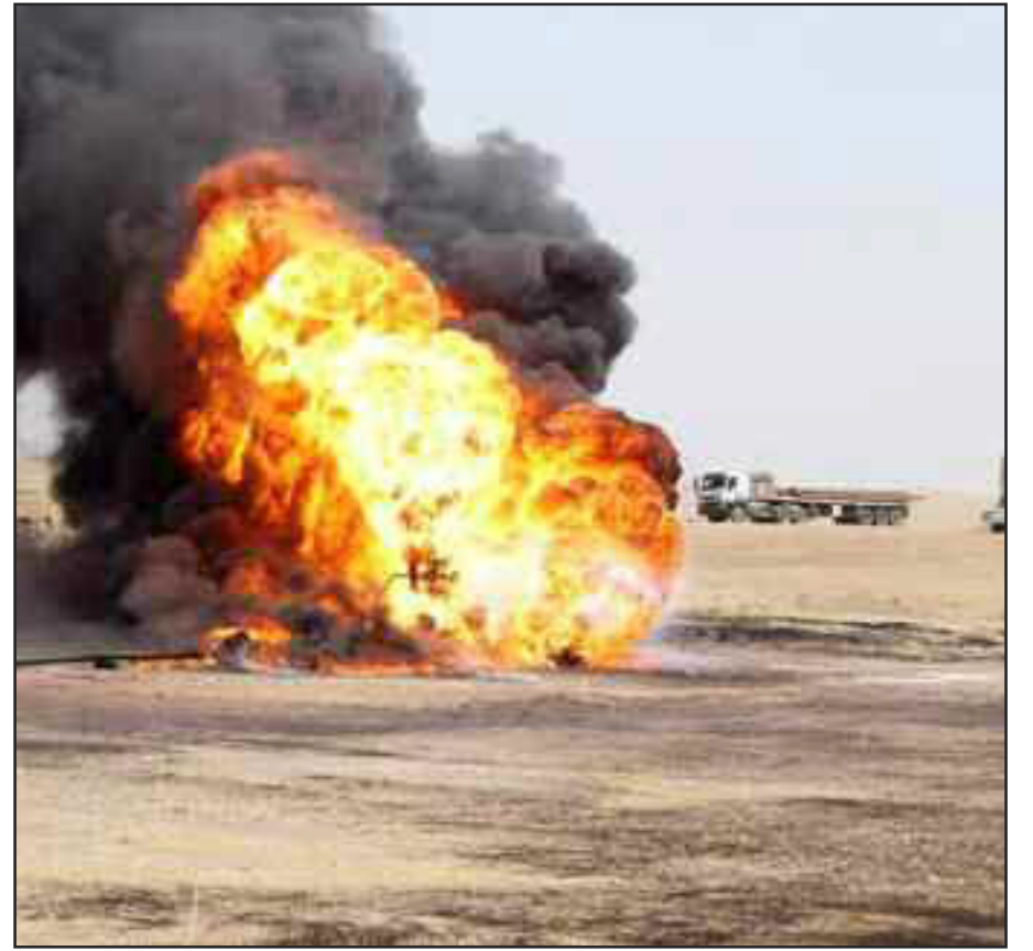
वगदाद में एक तेल के कुएं में आग लगने के बाद उठता हुआ धुआं।

सिंगापुर, (एजेंसी)। कोरोना वायरस की पहली लहर पर सख्त लॉकडाउन के जरिए काबू पाने वाले सिंगापुर में अब दूसरी लहर का खतरा मंडरा रहा है। न्यूज एजेंसी के मुताबिक, एक लोकल हॉस्पिटल से संक्रमण फैला। यह भी अहम है कि ये लोकल और नया वैरिएंट है। इसके 64 मामलों की पुष्टि हो चुकी है। इनमें से एक वैरिएंट वो भी है जो इन दिनों भारत में पाया जा रहा है और जो ज्यादा तेजी से फैलता है। नए मामले सामने आने के बाद एडमिनिस्ट्रेशन ने सख्त कदम उठाना शुरू कर दिए हैं। बॉर्डर पर सख्ती बढ़ाई गई है। इसके अलावा भीड़ रोکنे के लिए भी नियम तय कर दिए गए हैं। हेल्थ मिनिस्टर किम योंग के मुताबिक-अगर हालात बिगड़ते हैं तो आंशिक लॉकडाउन लगाया जा सकता है। कई महीने से यहां बहुत कम संक्रमण के मामले सामने आए थे।