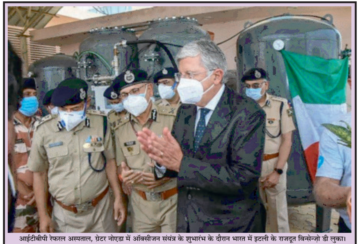
आईटीबीपी रेफरल अस्पताल, ग्रेटर नोएडा में ऑक्सीजन संयंत्र के शुभारंभ के दौरान भारत में इटली के राजतूत विसेन्जो डी लुका।

इसके साथ ही केजरीवाल ने कहा कि दिल्ली में अब तक हम 35,74,000 वैक्सीन खोज दे चुके हैं। लगभग 28 लाख लोगों ने पहली खोज ली है, इनमें से 7,76,000 लोगों ने दोनों खोज ली हैं। 18-45 आयु वर्ग में 3 दिन के अंदर दिल्ली में लगभग 1,30,000 लोगों को वैक्सीन लगाई गई है।