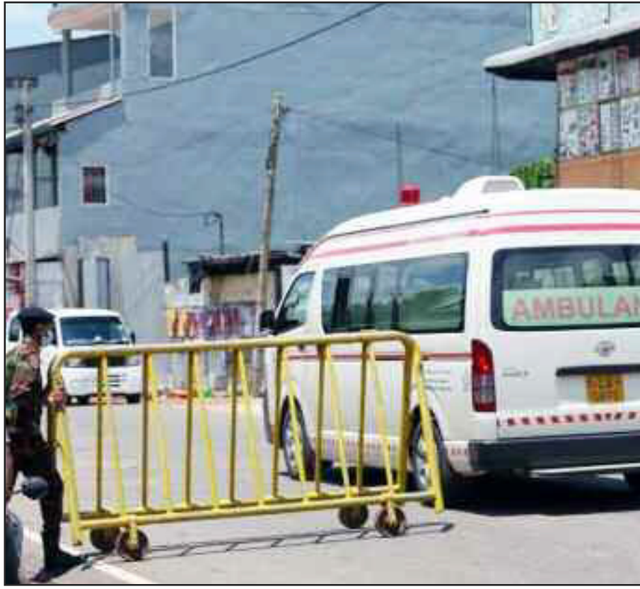
श्रीलंका की राजधानी कोलंबो में महारंगमा इलाके को स्वास्थ्य अधिकारियों ने बैरिकेड लगाकर अलग-थलग कर दिया।