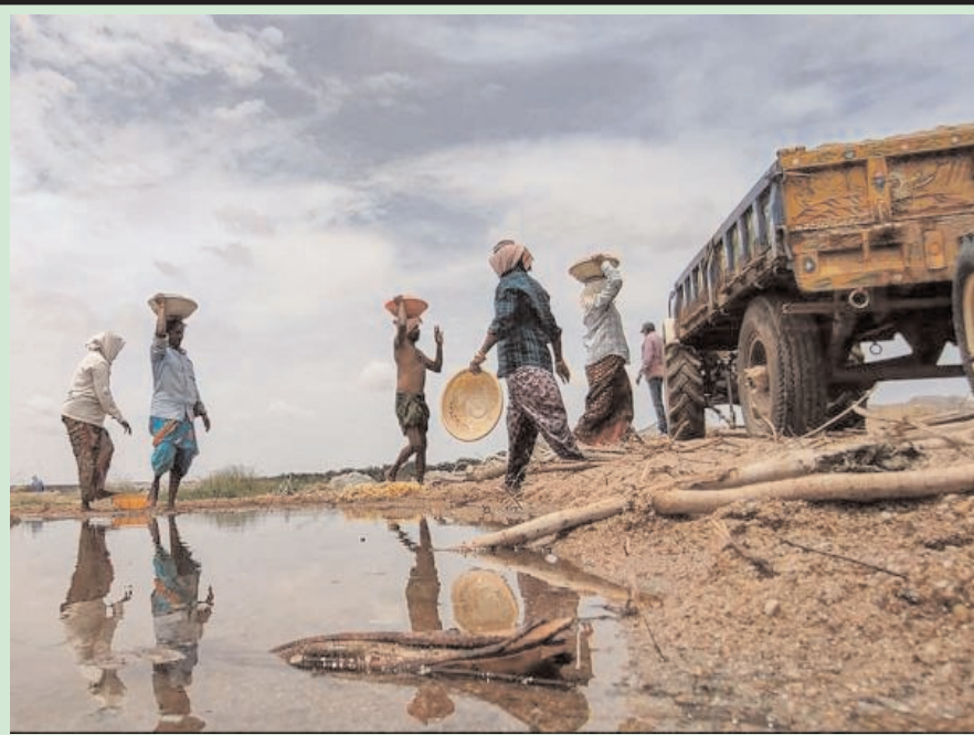
नलगांडा जिले के राबुलपेटा गांव के पास मुसी नदी के किनारे से ट्रकों पर बालू लादते मजदूर.