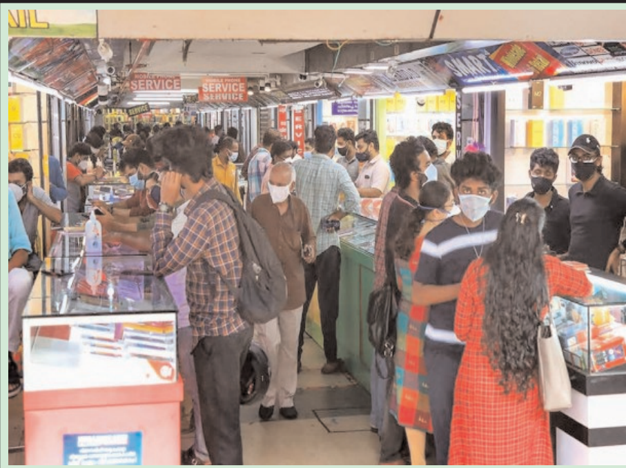
कोड़िकोड में कोविड-प्रेरित लॉकडाउन में ढील के बाद लोग मोबाइल एक्सप्रेसरीज खरीदते हुए।