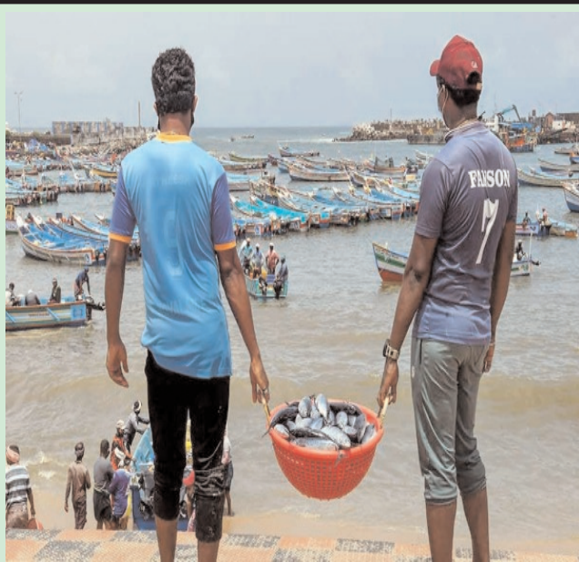
तिरुवनंतपुरम के विभिन्न बंदरगाह पर अधिकारियों द्वारा कोविड - 19 लॉकडाउन के प्रतिबंधों में ढील देने के बाद मछुआरे एक टोकरी में मछली ले जाते हुए।