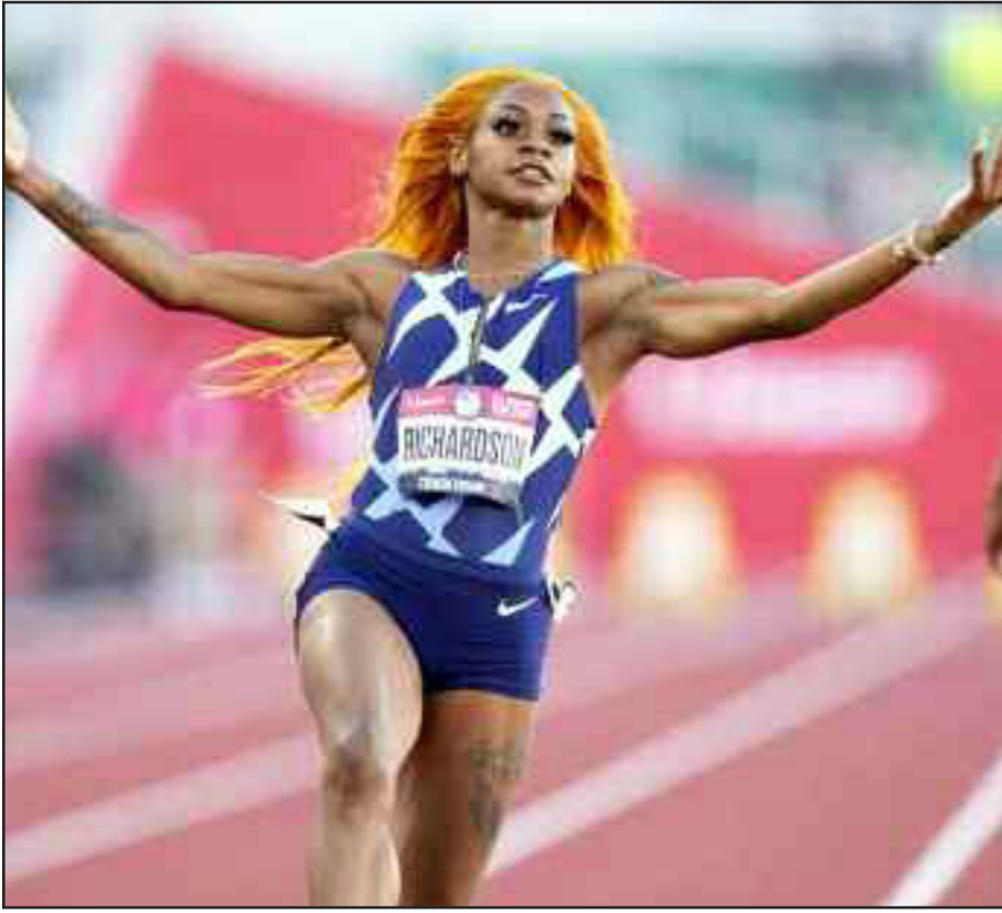
अमेरिकी ओलंपिक ट्रेक और फील्ड ट्रायल में महिलाओं की 100 मीटर दौड़ के दौरान चौथी हीट जीतने के बाद जश्न मनाती हुई कैरी रिचर्डसन।