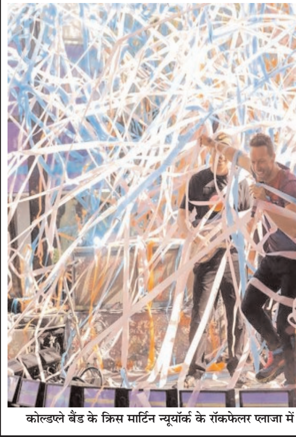
अमेरिकी राष्ट्रपति जो बाइडन

राष्ट्रपति ने अबतक टीका नहीं लगवाए लोगों से वायरस के नए स्त्रन से बचने के लिए जल्द से जल्द