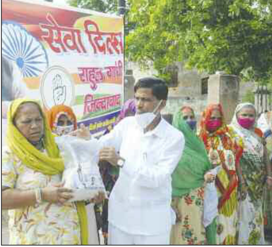
नई दिल्ली। दिल्ली प्रदेश कांग्रेस कमिटी के उपाध्यक्ष जय किशन ने राहुल गांधी के जन्म दिन पर गरीबों को राशन बाँटा।