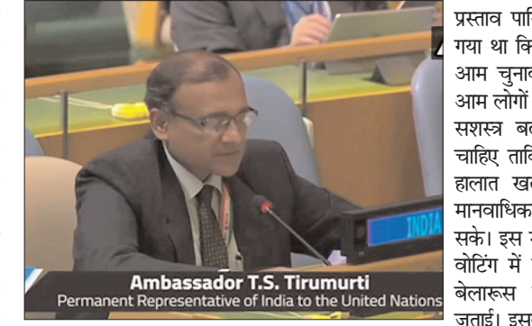
अमेरिकी राष्ट्रपति जो बाइडन

इस मसौदे पर वोट नहीं देने के भारत के फैसले पर स्पष्टीकरण देते हुए उन्होंने कहा, पारित मसौदे में भारत के विचार परिलक्षित नहीं रहे हैं। हम यह दोहराना चाहते हैं कि यदि अंतरराष्ट्रीय समुदाय इस मुद्दे का शांतिपूर्ण समाधान निकालने के लिए तैयार है तो इसमें म्यांमार के पड़ोसी देशों और क्षेत्रों के परामर्शी और रचनात्मक दृष्टिकोण को अपनाना महत्वपूर्ण है।