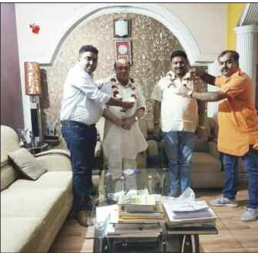
अखिल वैश्विक क्षत्रिय महासभा के केंद्रीय कार्यालय दिल्ली में मीटिंग संपन्न।

प्रस्तावित महापंचायत में भीड़ जुटाने के लिए गांवों में लगातार बैठकें चल रही हैं। इसी कड़ी में शुक्रवार को नांगल कला में बैठक कर समर्थन की मांग की गई। ग्रामीणों का कहना है कि बॉर्डर बंद होने के चलते लोग कई महीने से परेशान हैं। इसके लिए हरियाणा के साथ ही दिल्ली के गांवों से लोगों का भी समर्थन मिल रहा है। महापंचायत कर मांगों को पूरा कराने का प्रयास किया जाएगा। किसानों ने रुकवाया ग्रीन फील्ड हाईवे का काम- उधर, गोहाना के गांव बिचपड़ी के किसानों ने शुक्रवार को अपने गांव में सोनीपत-जाँट ग्रीन फील्ड हाईवे का काम रुकवा दिया। किसानों ने हाईवे पर धरना शुरू कर दिया है। किसान खेतों के पक्के रास्ते को बंद करने से नाराज हैं। किसानों ने खेतों में जाने के लिए हाईवे पर अंडरपास बनाने की मांग की। उन्होंने कहा कि जब तक अंडरपास नहीं बनाया जाएगा तब तक उनका धरना जारी रहेगा। किसानों ने उपायुक्त और एनएचआइ के प्रोजेक्ट डायरेक्टर को मांगपत्र भेजे। नेशनल हाईवे अथॉरिटी आफ इंडिया (एनएचएआई) द्वारा सोनीपत से जाँट तक ग्रीन फील्ड हाईवे तैयार करवाया जा रहा है। सोनीपत से गोहाना तक पहले से बने रोड को फोरेलेन बनाया जा रहा है।