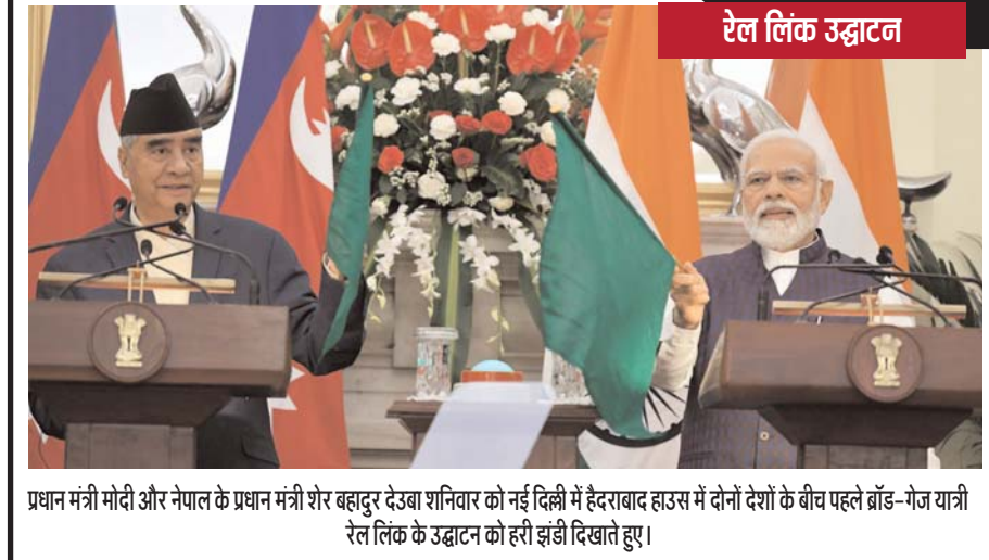
प्रधानमंत्री मोदी और नेपाल के प्रधानमंत्री शेर बहादुर देउबा शनिवार को नई दिल्ली में हैदराबाद हाउस में दोनों देशों के बीच पहले ब्रॉड-गेज यात्री रेल लिंक के उद्घाटन को हीरी इतिहासिक रूप से

अश्गाबाद, नयी दिल्ली। राष्ट्रपति राम नाथ कोविंद की मध्य एशियाई देश तुर्कमेनिस्तान की यात्रा के दौरान शनिवार को दोनों पक्षों के बीच चार समझौतों पर हस्ताक्षर किए गए। कोविंद तुर्कमेनिस्तान की तीन दिवसीय राजकीय यात्रा पर हैं। यह किसी भारतीय राष्ट्रपति की पहली तुर्कमेनिस्तान यात्रा है। कोविंद और मेजबान राष्ट्रपति सर्दार बर्दीमुहमदेव की उपस्थिति में दोनों देशों के प्रतिनिधियों ने चार समझौतों पर हस्ताक्षर किए।