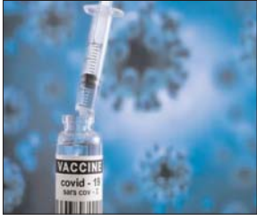
कोवीशील्ड की कीमत 600 रुपए होगी

नई दिल्ली। 18 साल से अधिक उम्र के लोगों को 10 अप्रैल से कोरोना वैक्सिनेशन का तीसरा डोज लगाया जाएगा। स्वास्थ्य मंत्रालय ने इसे प्रिकॉशन डोज नाम दिया है। हेल्थ वर्कर्स और 60 साल से अधिक उम्र के लोगों को यह मुफ्त लगाया जाएगा, जबकि बाकी व्यक्तियों को भुगतान करना होगा। यह प्राइवेट वैक्सिनेशन सेंटर पर लगाया जाएगा। यह डोज सिर्फ उन्हीं लोगों को लगाया जाएगा जिनकी उम्र 18 साल से अधिक है और जिन्होंने दूसरा डोज नौ महीने या उससे पहले लगावाया था।