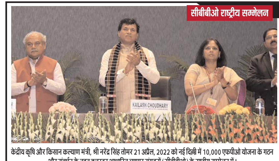
केंद्रीय कृषि और किसान कल्याण मंत्री, श्री नरेंद्र सिंह तोमर 21 अप्रैल, 2022 को नई दिल्ली में 10,000 एफपीओ योजना के गठन और संवर्धन के तहत वलस्टर आधारित व्यापार संगठनों (सीबीबीओ) के राष्ट्रीय सम्मेलन में।

केरल में कोरोनावायरस के सक्रिय मामलों में 111 की वृद्धि होने से इनकी संख्या 2543 हो गयी है। इससे निजात पाने वाले लोगों की संख्या 191 बढ़कर 6466959 हो गयी, जबकि मृतकों की संख्या में 53 की बढ़ोतरी होने से यह आंकड़ा 68702 पर पहुंच गया है।