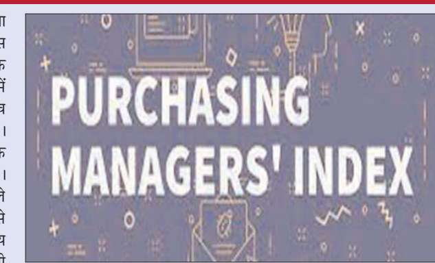
रिपोर्ट में कहा गया है, अप्रैल के आंकड़ों से निर्यात ऑर्डर में फिर तेजी लौटने के संकेत हैं जबकि नौ महीने बाद मार्च में इसमें पहली बार गिरावट

एजेसी नयी दिल्ली। नए ऑर्डर में तेजी की बढ़ोतरी के बावजूद भारत का विनिर्माण क्षेत्र पर्चेजिंग मैनेजर्स इंडेक्स (पीएमआई) अप्रैल में बढ़कर 54.7 अंक रहा। यह जानकारी वित्तीय परामर्श एजेसी एसाएंडपी ग्लोबल ने दी। मार्च में विनिर्माण पीएमआई 54 अंक था। पीएमआई में बढ़ोतरी घरेलू विनिर्माण क्षेत्र में सुधार का संकेत है। पीएमआई के 50 अंक से ऊपर होने का मतलब आर्थिक गतिविधियों में विस्तार और