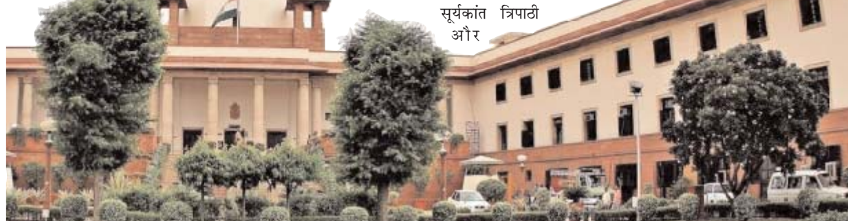
CJI एनवी रमना, जस्टिस सूर्यकांत त्रिपाठी और

जस्टिस हिमा कोहली की बेंच ने यह भी आदेश दिया है कि इसके बाद भी यदि कोई नया केस दर्ज किया जाता है तो पीडित पक्ष कोर्ट का दरवाजा खटखटा सकता है। निचली अदालतों से भी अपील है वे पारित आदेश को ध्यान में रखते हुए मांगी गई राहत की जांच करें। गौरतलब है कि कपिल सिब्बल ने कोर्ट में जानकारी दी है कि देशद्रोह कानून के तहत देशभर की जेलों में 13 हजार लोग आज तक बंद हैं। पांच पक्षों ने सुप्रीम कोर्ट में 10 याचिकाएं