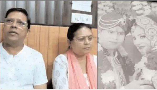
इसमें महिला ने कहा कि उन्होंने बेटे को पढ़ाई और एक सफल इंसा बनाने में बहुत धन खर्च किया। इसके बाद 2016 में बेटे की शादी की और खूब पैसा खर्च किया। उन्होंने अपने खर्च

हरिद्वार। हरिद्वार में एक अजीब मामला सामने आया है। यहां एक बुजुर्ग दंपती ने अपने बेटे और बहू से कह दिया है कि या तो एक साल के अंदर उन्हें पोता या पोती दें या फिर उनकी परवरिश में खर्च हुए पांच करोड़ रुपये वापस करें। यह मांग लेकर दोनों हरिद्वार जिला अदालत पहुंच गए। उनका कहना है कि उनके बेटे और बहू ने बच्चा पैदा करने से इनकार कर दिया है और इस वजह से वे मानसिक यातना झेल रहे हैं।