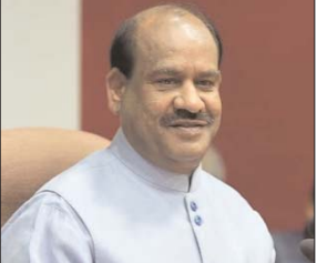
लोगों की परेशानियों के प्रति और संवेदनशील बनाने पर होना चाहिए ताकि लोगों का लोकतांत्रिक संस्थाओं में भरोसा और मजबूत हो सके। देश के पूर्वोत्तर हिस्से की बात करते हुए श्री बिरला ने कहा कि इस क्षेत्र की अलग तरह की राजनीतिक और भौगोलिक स्थिति के कारण इसकी विकास यात्रा भी बहुत चुनौतीपूर्ण रही। इतना विकास होने के बावजूद अब भी अधरसंरचना, शिक्षा, स्वास्थ्य, सुरक्षा, संपर्क और कई अन्य कारकों से बहुत कुछ होना बाकी है। हमें इन सभी क्षेत्रों का भी पर्याप्त विकास करना है। प्रधानमंत्री नरेंद्र मोदी के नेतृत्व में केंद्र द्वारा इस क्षेत्र के विकास के लिए दिये

ईटानगर। लोकसभा अध्यक्ष ओम बिरला ने निर्णय लेने की प्रक्रिया में लोगों की सहभागिता बढ़ाये जाने तथा लोकतांत्रिक संस्थाओं को और संवेदनशील बनाने की जरूरत पर बल देते हुए गुरुवार को कहा कि ऐसा करने से लोकतांत्रिक संस्थाओं में लोगों का भरोसा मजबूत होगा। यहां अरुणाचल प्रदेश विधानसभा में दौरजी खांडू सभागार में राष्ट्रमंडल संसदीय संघ (सीपीए) के भारतीय क्षेत्रीय जून की तीसरी बैठक को सम्बोधित करते हुए श्री बिरला ने कहा आज हमारे लोकतंत्र के सामने सबसे बड़ी चुनौती यह है कि किस तरह से पूरी क्षमता और मजबूत हो सके। देश के पूर्वोत्तर हिस्से की बात करते हुए श्री बिरला ने कहा कि इस क्षेत्र की अलग तरह की राजनीतिक और भौगोलिक स्थिति के कारण इसकी विकास यात्रा भी बहुत चुनौतीपूर्ण रही। इतना विकास होने के बावजूद अब भी अधरसंरचना, शिक्षा, स्वास्थ्य, सुरक्षा, संपर्क और कई अन्य कारकों से बहुत कुछ होना बाकी है। हमें इन सभी क्षेत्रों का भी पर्याप्त विकास करना है। प्रधानमंत्री नरेंद्र मोदी के नेतृत्व में केंद्र द्वारा इस क्षेत्र के विकास के लिए दिये