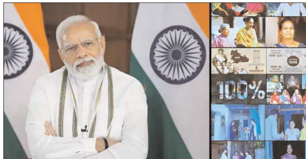
निरंतर प्रयास रहा है कि कोई भी हकदार सरकारी योजनाओं के लाभ से वंचित न रह जाए। उन्होंने कहा, जब हम किसी भी योजना में शत प्रतिशत लक्ष्य को हासिल करते हैं, तो इसका मतलब होता है शासन-प्रशासन संवेदनशील है...जब से चुंशशन

भरूच। प्रधानमंत्री नरेंद्र मोदी ने कहा कि किसी भी सरकारी योजना में जब शत प्रतिशत लक्ष्य हासिल कर लिया जाता है तो इससे तृष्ठीकरण की राजनीति समाप्त होती है। प्रधानमंत्री आयोजित उत्कर्ष समारोह को वीडियो कांफ्रेंस के माध्यम से संबोधित कर रहे थे। यह आयोजन भरूच जिले में राज्य सरकार की चार प्रमुख सरकारी योजनाओं के शत प्रतिशत लक्ष्य पूरा होने के अवसर पर किया गया है। कार्यक्रम को संबोधित करते हुए पीएम मोदी ने कहा कि उनके नेतृत्व में केंद्र सरकार के पिछले आठ वर्ष सेवा, सुरासन और गरीब कल्याण को समर्पित रहे हैं और उनकी सरकार का