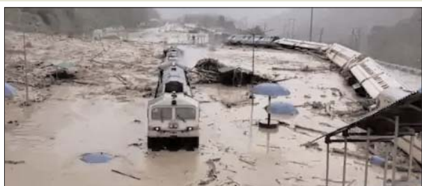
असम के कछार जिले में स्थिति गंभीर

इस प्राकृतिक आपदा से इंसानों के अलावा 1,434 जानवर भी प्रभावित हुए हैं और अब तक कुल 202 घर क्षतिग्रस्त हो चुके हैं। वहीं, लगभग 10,321.44 हेक्टेयर खेती की भूमि बाढ़ के पानी में डूब गई है।