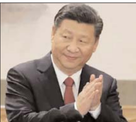
है कि सभी राशन चीनी सरकार द्वारा वितरित किए गए थे लेकिन ग्रामीणों को दिए गए राशन में चीनी कम्युनिस्ट पार्टी के ट्रेडमार्क को बैंग में छुपाया गया था। रिपोर्ट में कहा गया है कि सबसे खराब रिश्त विदेश मंत्रालय के कर्मचारियों को सूखे राशन का वितरण किया जाना था।

कोलंबो। श्रीलंका की आर्थिक स्थिति बंद से बदतर होती जा रही है। ज़रूरी चीजों की लगातार कमी होती जा रही है और इस बीच चीन द्वारा श्रीलंकाई विदेश मंत्रालय के अधिकारियों को बांटे गए राशन के कारण श्रीलंकाई विदेश सेवा अधिकारी संघ ने चीन को लताड़ लगाई है। संकटग्रस्त श्रीलंका में अधिकारियों को प्रभावित करने के लिए दाल, चावल और अन्य वस्तुओं जैसे राशन वितरित करने के चीन को कोशिशों को कड़े विरोध का सामना करना पड़ा है। कोलंबो गजट की एक रिपोर्ट बताती