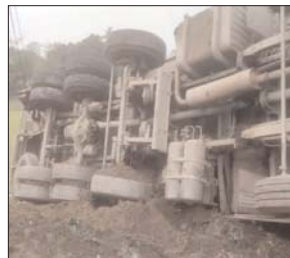
बोरिंग के लिए लोहे के पाइप लोड कर अंगरतला से जम्मू कश्मीर बोरेल के काम से पाइप लेकर जा रहा था। एनएच 57 पर डाइवर को डाइपकी आ गई, जिससे ट्रक अनियंत्रित होकर पलट गई। मेरी नौद खुली तो देखा अन्य मेरे पापा और चाचा समेत अन्य साथ पाइप के नीचे दबे थे। उनके पास गया तो पता चला कि दोनों की सांसे थम चुकी थीं। कुल 8 लोगों की लाशें पड़ी हुई थीं। मैं सन्न रह गया।

घटना के बाद इलाके में हड़कंप मच गया। आसपास के लोगों की भीड़ लग गई। इधर, सूचना मिलते ही पुलिस मौके पर पहुंच गई और शवों को कब्जे में लेकर पोस्टमॉर्टम के लिए अस्पताल भेज दिया।