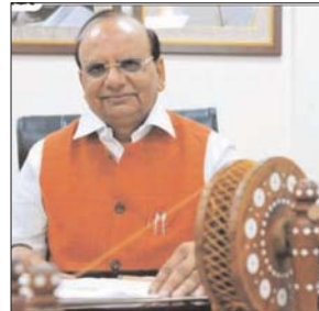
खादी को ब्रांड बनाने वाले विनय कुमार सक्सेना को दिल्ली का नया उप राज्यपाल नियुक्त किया गया है। वे फिलहाल खादी और ग्रामोद्योग आयोग के अध्यक्ष हैं। सक्सेना अनिल बैजल की जगह लेंगे। बैजल ने 18 मई को ही अपना इस्तीफा राष्ट्रपति को भेज दिया था, जिसे स्वीकार कर लिया गया है। सक्सेना कॉर्पोरेट वर्ल्ड से आने वाले ऐसे पहले शख्स हैं जिन्हें एलजी बनाया गया है। अमूमन दिल्ली में उपराज्यपाल के पद पर रिटायर्ड आईएएस और आईपीएस ही नियुक्त किए जाते रहे हैं। सक्सेना 27 अक्टूबर 2015 से खादी

नई दिल्ली। खादी को ब्रांड बनाने वाले विनय कुमार सक्सेना को दिल्ली का नया उप राज्यपाल नियुक्त किया गया है। वे फिलहाल खादी और ग्रामोद्योग आयोग के अध्यक्ष हैं। सक्सेना अनिल बैजल की जगह लेंगे। बैजल ने 18 मई को ही अपना इस्तीफा राष्ट्रपति को भेज दिया था, जिसे स्वीकार कर लिया गया है। सक्सेना कॉर्पोरेट वर्ल्ड से आने वाले ऐसे पहले शख्स हैं जिन्हें एलजी बनाया गया है। अमूमन दिल्ली में उपराज्यपाल के पद पर रिटायर्ड आईएएस और आईपीएस ही नियुक्त किए जाते रहे हैं। सक्सेना 27 अक्टूबर 2015 से खादी