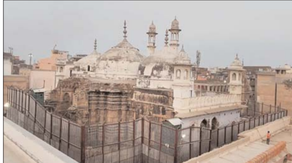
नहीं होने की वजह से उन्हें अंदर नहीं जाने दिया गया। बाहर बड़ी संख्या में पुलिस और पीएसी के जवान तैनात रहे। विश्वनाथ मंदिर के पूर्व महंत ने दाखिल की याचिका