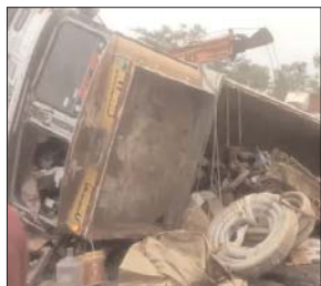
जिसके उनको मौके पर ही मौत हो गई। बताया जा रहा है कि 12 मजदूर राजस्थान के उदयपुर और बाकी जिलों के थे। वहीं 2 मजदूर उत्तर प्रदेश के बताए जा रहे हैं।

सुबह-सुबह ट्रक अनियंत्रित होकर एनएच-57 पर पलट गया। हादसे के वक सभी मजदूर उसमें लदे लोहे के डाइप पर सो रहे थे। जैसे ही ट्रक पलटा 8 मजदूर उसी पाइप के नीचे दब गए।