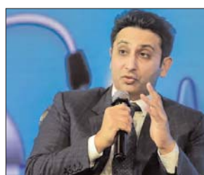
होनी चाहिए जिससे कि कच्चा माल आराम से सप्लाई हो सके, इसके अलावा बौद्धिक संपत्ति को भी एक दूसरे का सझा किया जा सके। वैक्सीन

पूनावाला स्विटजरलैंड के दावोस में वर्ल्ड इकोनॉमिक फोरम में हिस्सा लेने पहुंचे थे। उन्होंने एक भारतीय टीवी चैनल को दिए इंटरव्यू में कई बातें कहीं। उन्होंने कहा, हमें पता है कि महामारी के बीच क्या बुरा हुआ और क्या ठीक हुआ। पूनावाला ने कहा, हमें उम्मीद है कि कच्चे माल की उपलब्धता, वैक्सीन सर्टिफिकेट की मान्यता, क्लीनिकल ट्रायल और मैनुफैक्चरिंग जैसी दिक्कतें अब नहीं आएंगी।