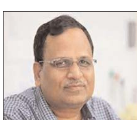
चार्ज बैटरी लगाने की व्यवस्था को आसान बनाना है। उन्होंने कहा कि यह निर्णय आज दिल्ली

काफी मजबूत किया जा रहा है। ई-व्हीकल की बैटरी खत्म होने पर उसे रि-चार्ज करने में वक की बर्बादी ना हो, साथ ही रिचार्ज प्रक्रिया आसान हो, इसके लिए दिल्ली सरकार की ओर से पटपटुगंज, बवाना इंडस्ट्रियल एरिया सेक्टर-5 और नरेला सेक्टर-बी में इलेक्ट्रिक व्हीकल चार्जिंग और बैटरी स्वैपिंग स्टेशन बनाए जाएंगे। इसका मुख्य उद्देश्य ई-व्हीकल को डिस्चार्ज बैटरी को बदलकर पूरी तरह