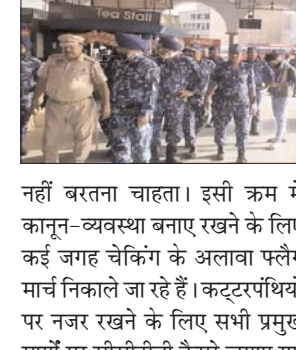
नहीं बरतना चाहता। इसी क्रम में कानून-व्यवस्था बनाए रखने के लिए कई जगह चेकिंग के अलावा फ्लैग मार्च निकाले जा रहे हैं। कट्टरपंथियों पर नजर रखने के लिए सभी प्रमुख मार्गों पर सीसीटीवी कैमरे लगाए गए हैं। कट्टरपंथी संगठन सोशल मीडिया पर सक्रिय दल खालसा, शिरोमणि अकाली दल (अमृतसर) और कुछ अन्य कट्टरपंथी

अमृतसर। कट्टरपंथी सिख संगठनों ने ऑपरेशन ब्लू स्टार की 38वीं बरसी पर आगामी 6 जून को अमृतसर बंद रखने का आह्वान किया है। संगठनों ने 6 जून के लिए समर्थन जुटाने का अभियान शुरू कर दिया है। सिख संगठन 5 को स्वतंत्रता मार्च निकालने की घोषणा भी कर चुके हैं। दूसरी तरफ इन सबके बीच पुलिस ने शांति-व्यवस्था बनाए रखने के लिए कमर कस ली है। पंजाब और पड़ोसी राज्यों में पिछले कुछ समय में खालिस्तान मूवमेंट से जुड़ी कई एंक्टिविटी नजर आई हैं। पटियाला में दो समुदायों के बीच झड़प के बाद से पंजाब में माहौल चिंताजनक है। ऐसे में पुलिस प्रशासन ऑपरेशन ब्लू स्टार की बरसी के मौके पर ढील