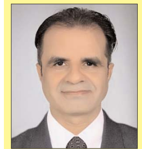
कट्टर इमानदार सिस्टम कायम करने, भ्रष्टाचारियों की सफाई का अभियान हर सरकारों को चलाना जरूरी

पहले भ्रष्टाचारियों को सफाई करना जरूरी है इसके लिए अंदर के भ्रष्टाचार रूपी दीमक की सफाई करने गुप्त विज्ञान चलाना चाहिए और बड़ी मछलियों को पहले सबक सिखाना चाहिए ताकि सिस्टम में शीघ्र से शीघ्र कट्टर इमानदार सिस्टम कायम हो सके और सब प्रतिशत आर्वाइत रकम उसी उद्देश्य में खर्च हो तो भारत को सही की चिड़िया बनने और बड़े नुजुर्गों के सतयुग रुपी स्वप्ना को हम अति शीघ्र पूरा करेंगे। साथियों बात अगर हम कट्टर इमानदार सिस्टम कायम करने की करें तो जिस तरह हम अपने और अपनी आने वाली अगली पीढ़ियों के लिए इंफ्रास्ट्रक्चर से लेकर नए विज्ञान पर काम कर रहे हैं जिसमें विज्ञान 2047, विज्ञान 5 ट्रिलियन डॉलर अर्थव्यवस्था, विज्ञान सागरमाला भारतमाला सहित इत्यादि अनेक परियोजनाएँ शामिल है इसके लिए हम सबसे पहले कट्टर इमानदार सिस्टम और भ्रष्टाचार की सफाई इन दो अभियानों पर तात्कालिक रोडमैप बनाकर कार्रवाई करना होगा। हालांकि भ्रष्टाचार के खिलाफ सरकारों की जंग जारी है परंतु अब समय आ गया है कार्यवाही शीघ्र स्तर से जारी कर चरपरासी पद स्तर तक तीव्रता से रणनीतिक रोडमैप बनाकर की जाए सारे संलग्न व्यक्तियों की संपत्तियाँ, रहन सहन, विदेश और लोकल