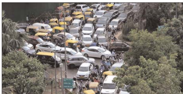
बारिश से तापमान में 15 डिग्री की गिरावट

यहां करीब 4 बजे के बाद से तेज बारिश और आंधी के हालात बने। मौसम विभाग ने पहले से ही हल्की बारिश होने और 50 किमी प्रति घंटे