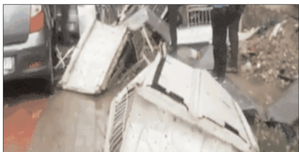
जामा मस्जिद के गुंबद का कुछ हिस्सा क्षतिग्रस्त

लाल किले के पास अंगूरुबाग इलाके में बारिश के कारण एक 65 साल के व्यक्ति की मौत हो गई है। उनके ऊपर पेड़ आ गिरा था। वहीं जामा मस्जिद के पास एक 50 साल के व्यक्ति की मौत हो गई। उनके ऊपर बालकनी का एक हिस्सा आ गिरा था। दिल्ली पुलिस ने बताया कि पेड़ गिरने की घटनाओं की जानकारी देने के लिए रात आठ बजे तक 294 कॉल आए। मौसम विभाग के अनुसार हवा की गति 100 किमी प्रति घंटे तक रही है।