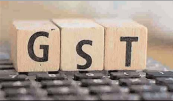
और माल के आयात पर एकत्रित 931 करोड़ रुपये है। सरकार ने करोड़ रुपये सहित उपकर 10502 आईजीएसटी से 27924 करोड़ रुपये

एजेंसी नई दिल्ली। देश का सकल वस्तु एवं सेवा कर (जीएसटी) राजस्व संग्रह इस वर्ष मई में पिछले वर्ष की समान अवधि के 97821 करोड़ रुपये के मुकाबले 44 प्रतिशत की बढ़ोतरी लेकर 140885 करोड़ रुपये पर पहुंच गया। वित्त मंत्रालय की ओर से बुधवार को जारी आंकड़ों के अनुसार, मई 2022 में कुल 140885 करोड़ रुपये जीएसटी राजस्व संग्रहित किया गया, जो मार्च 2021 के 97821 करोड़ रुपये से 44 प्रतिशत अधिक है। जीएसटी प्रणाली लागू होने के बाद चौथी बार और इस वर्ष मार्च से लगातार तीसरी बार जीएसटी राजस्व संग्रह 1.40 लाख करोड़ रुपये के पार पहुंचा है। मई, 2022 में सकल जीएसटी राजस्व 140885 करोड़ रुपये है, जिसमें से सीजीएसटी 25036 करोड़ रुपये, एसजीएसटी 32001 करोड़ रुपये, वस्तुओं के आयात पर एकत्रित 37469 करोड़ रुपये सहित आईजीएसटी 73345 करोड़ रुपये