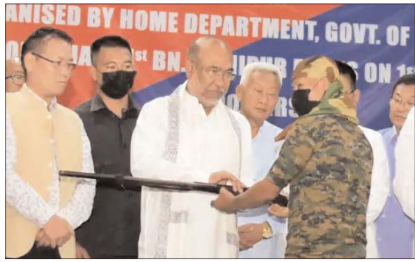
सामान्य जीवन जी सकें।

साथ संगठन के कार्यकर्ताओं ने दो एचके-33 राइफल, एक एक राइफल, कई छोटे हथियारों के साथ एक चीन हैंड ग्रेनेड पर भी सौंप दिए। इस अवसर पर बोलते हुए, राज्य के मुख्यमंत्री बीरेन सिंह ने कहा कि हिंसा स्थायी समाधान नहीं ला सकती है। उन्होंने बाकी लोगों से भी मुख्यधारा में लौटने और सामान्य जीवन जीने की अपील की है। मुख्यमंत्री ने कहा, जो लोग घर वापसी चाहते हैं, उनके लिए केंद्रीय गृह मंत्री अमित शाह ने पहले ही सांजैतिक रूप से घोषणा कर दी थी कि जघन्य अपराध में शामिल लोगों को छोड़कर सभी को किसी भी तरह के मामले या फिर प्राथमिकी से छूट दी जानी चाहिए ताकि वे अपना