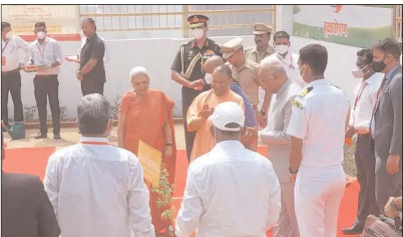
पटेल भी उपस्थित रहें।

वहीं इससे पहले राष्ट्रपति रामनाथ कोविंद ने शनिवार देर शाम गोरखनाथ मंदिर पहुंच कर, अपनी देश की प्रथम महिला सविता कोविंद के साथ गुरु गोरखनाथ का दर्शन-पूजन किया। नाथ पंथ की इस पीठ पर पधारे राष्ट्रपति का गोरक्षपीठाधीश्वर मुख्यमंत्री योगी आदित्यनाथ की अगुवाई में अभूतपूर्व स्वागत हुआ। राष्ट्रपति ने गोरखनाथ मंदिर में पूजा अर्चना के बाद गोशाला जा कर गोसेवा की। मुख्यमंत्री की तरफ से आयोजित जलपान में शामिल हुए। राष्ट्रपति के साथ प्रदेश की राज्यपाल आनंदी बेन