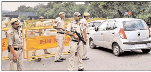
भगवा आतंकवादियों को अब दिल्ली, बॉम्बे, यूपी और गुजरात में अपने अंत का इंतजार करना चाहिए।