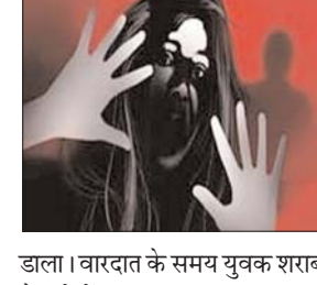
डाला। वादादत के समय युवक शराब के नशे में था।

भिवाड़ी (अलवर)। राजस्थान के अलवर में 14 साल की रेप पीडिता ने आरोपी युवक की हत्या कर दी। रेप करने वाला पूर्व सरपंच का बेटा था, जिसकी लाश 18 मई को अलवर के कोटकासिम इलाके में सड़क के किनारे मिली। पुलिस ने खुलासा किया है कि लड़के का मर्डर किया गया था।