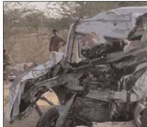
कार में फंस गए थे बारातियों के शव

बारात में शामिल लोग कांभी की ढाणी जा रहे थे। बारात में शामिल अन्य वाहन से बाराती उतरे और गाड़ी में फंसे लोगों को बाहर निकालने का प्रयास किया। हादसा इतना भीषण था कि फंसे लोगों को बड़ी मुश्किल से बाहर निकाला। कई लाशें एक दूसरे से चिपकी हुई थीं।