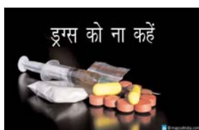
ड्रग्स को ना कहे

नयी दिल्ली। वित्त मंत्रालय की एजेंसी केन्द्रीय अप्रत्यक्ष कर एवं सीमा-शुल्क बोर्ड (सीबीआईसी) बुधवार को लखनऊ, पटना और मुंबई समेत देश भर में 14 जगह कुल करीब 42,000 किलोग्राम मादक द्रव्य नष्ट करेगी। वित्त मंत्रालय की एक विज्ञप्ति के अनुसार सीबीआईसी वित्त मंत्रालय के विशिष्ट सहाय के कार्यक्रमों के सिलसिले में कल मादक औषधि विध्वंस दिवस का आयोजन किया है। इसके तहत देश भर में 14 जगहों पर 42 हजार किलोग्राम के करीब जन्त मादक द्रव्यों को नष्ट किया जाएगा। विज्ञप्ति के अनुसार लखनऊ, मुंबई,