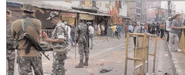
रांची। पैगंबर पर विवादित टिप्पणी को लेकर रांची में शुक्रवार को नमाज के बाद हिंसक प्रदर्शन हुआ। आगजनी और पथराव के चलते पुलिस को फायरिंग करनी पड़ी। इस फायरिंग में 35 साल के व्यक्ति की मौत हो गई। देर रात एक और शख्स की मौत की खबर है, हालांकि प्रशासन ने इसकी पुष्टि नहीं की है। 17 अन्य लोगों को गोली लगी है। 12 से ज्यादा लोग घायल हुए हैं। प्रदर्शन के दौरान उपद्रवियों ने पुलिस पर भी पथराव किया। SSP समेत 3 पुलिसकर्मी को चोटें आई हैं। रांची आए बिहार सरकार के पथ निर्माण मंत्री नितिन नवीन की गाड़ी पर भी उपद्रवियों ने हमला कर दिया। वे भाजपा कोटे से नीतीशा सरकार में मंत्री हैं।

मंदिर पर पथराव के बाद पुलिस ने की फायरिंग; हिंदू संगठनों ने पढ़ी हनुमान चालीसा