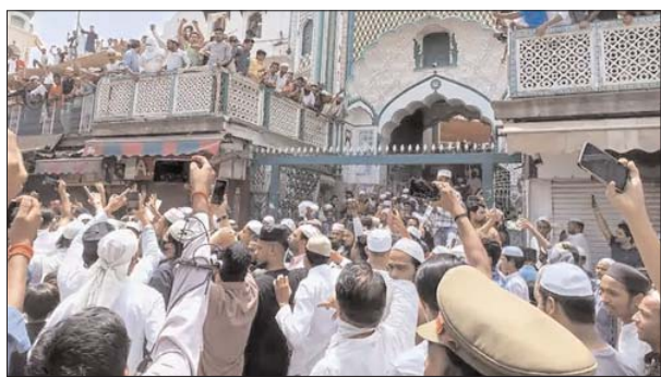
पुलिस की रणनीतिक काम आई।

लखनऊ/प्रयागराज। जिसका डर था। वही हुआ। शुक्रवार को जुमे की नमाज के बाद यूपी के कई शहरों में हिंसा भड़क गई। प्रयागराज में हालात सबसे ज्यादा खराब हो गए। पथराव में डीएम, एसएसपी, एडीजी, आईजी घायल हो गए। एसपी को गाड़ी टूट गई है। पीएससी के वाहन समेत 7 से ज्यादा गाड़ियों को फूंक दिया गया। आगजनी की गई। प्रयागराज में हालात इतने बिगड़ गए कि एडीजी को बंदूक उठानी पड़ी। अब यहां दो बुलडोजर मंगाए गए हैं, जो बवाल में शामिल लोगों के अवैध निर्माण को ध्वस्त करेंगे। अधिकारियों ने लोगों से उनके घरों से जुड़े कागज मांगे हैं। गृह मंत्रालय का अलर्ट-उपद्रवियों के निशाने पर राज्यों के छत्तक देशभर में प्रदर्शन के दौरान हुई हिंसक घटनाओं के बाद गृह मंत्रालय ने सभी राज्यों और केंद्र शासित प्रदेशों के पुलिस प्रमुखों (छत्तक) को सतर्क रहने का निर्देश जारी किया है। गृह मंत्रालय ने कहा है कि इस तरह की हिंसक घटनाओं में उपद्रवी पुलिस अधिकारियों को निशाना बना सकते हैं। ऐसे में उन्हें सतर्क रहने के लिए कहा गया है।