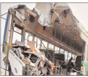
स्थित गोरखपुर चौराहे पर फोरलेन सड़क पर खड़ी एक ट्रक में बिहार से