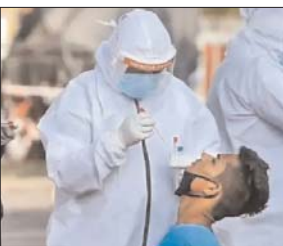
संक्रमण की पुष्टि हुई। इसमें 22 पुरुष व 30 महिला शामिल थीं। इसमें सात लोग दूरगम जिलों की यात्रा कर लौटे थे। 10 जून को गौतमबुद्ध की यात्रा कर लौटे तीन लोगों में संक्रमण की पुष्टि हुई है। ये लोग चिनहट और अलीगंज के रहने वाले हैं। वहीं दो दिन पूर्व गाजियाबाद की यात्रा कर लौटे दो लोगों में संक्रमण की पुष्टि हुई। ये मरीज कैसरबाग और सरोजनीनगर के हैं। दो दिन बाद बुखार व सर्दी-जुकाम हुआ। जांच में संक्रमण की पुष्टि हुई। मरीज के संपर्क में आने वाले छह लोगों की कोरोना रिपोर्ट पाँजटिव आई है।

लखनऊ। कोरोना की तीन लहर के बाद एक बार फिर संक्रमण का खतरा बढ़ता दिखाई दे रहा है। पिछले कुछ दिनों से लगातार कोरोना के केस बढ़ रहे हैं। अकेले राजधानी लखनऊ में बुधवार को 72 लोगों में संक्रमण की पुष्टि हुई है। इससे स्वास्थ्य विभाग में हलचल बढ़ गई है। करीब साढ़े तीन महीने बाद इतनी बड़ी तादाद में मरीज पाँजटिव पाए गए हैं। संक्रमण के 72 लोगों में 12 लोग संक्रमित पाए गए हैं। राहत की बात यह है कि किसी भी मरीज को अस्पताल में भर्ती करने की जरूरत नहीं पड़ी है। मौजूदा समय में 16 मरीज राजधानी के तीन अस्पतालों में भर्ती हैं। अन्य मरीज होम आइसोलेशन में है। सीएमओ डॉ मंमोज अग्रवाल ने बताया कि बाहर की यात्रा कर लौटे संक्रमित लोगों की जिनोम सीकेंसिंग कराई जा रही है। ताकि नए मरीजों के नए वैरिएंट की पहचान की जा सके। इससे पहले मंगलवार को 52 लोगों में