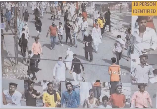
तस्दीक नगर निगम के अभियान के दौरान हुई है। उपद्रव के दिन से मंगलवार तक चलाए गए अभियान में नगर निगम ने इस इलाके 31 ट्रक ईट, पत्थर और बोल्टर अटाला में हटवाया है। इसमें मंगलवार को छह ट्रक छह ट्रक ईट-पत्थर मिला। इससे पहले 25

प्रयागराज। संगमनगरी प्रयागराज में बीते शुक्रवार को जुमे की नमाज के बाद हुई हिंसा और पत्थरबाजी मामले में पुलिस का एक्शन लगातार जारी है। बुधवार को प्रयागराज हिंसा के 40 और उपद्रवियों की सीसीटीवी फुटेज व वीडियो कैमरा से पहचान हुई। प्रयागराज एएसपी ने इन आरोपियों की गिरफ्तारी के लिए इनकी फोटो सोशल मीडिया के मदद से सार्वजनिक कर दिया है। पुलिस ने यह भी अपील की है कि आरोपी आत्मसमर्पण कर दें नहीं तो उनके खिलाफ कोर्ट से अनुमति लेकर कुर्की की कार्रवाई भी की जाएगी। वहीं, इस मामले में पुलिस ने अब तक 95 लोगों को गिरफ्तार किया है। आपको बता दें कि पिछले जुमे को अटाला में उपद्रव के लिए पत्थरबाजी की बड़े स्तर पर तैयारी हुई थी। इसकी