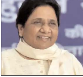
सरकार का चतुर्दिक विरोध दर्शा रहा है कि भाजपा ने जनाधार खो दिया है। सपा प्रमुख ने एक अन्य टवीट में सरकार को सलाह दी कि अग्निपथ की नीति सरकार ने बनायी है अतः सरकार व सत्तारीय बल के प्रवक्ता किसी और को आगे न करें। इसी टवीट में उन्होंने कहा कि अमीर उद्योगपतियों की आय को सुरक्षा से अधिक जरूरी है देश की सुरक्षा, इसीलिए जो भी बजट कम पड़ रहा है उसके लिए सरकार कॉर्पोरेट पर सुरक्षा के साथ चमझौता न करें। बहुजन समाज पार्टी की अध्यक्ष और राज्य की पूर्व मुख्यमंत्री मायावती ने

लखनऊ। समाजवादी पार्टी (सपा) के प्रमुख अखिलेश यादव और बहुजन समाज पार्टी (बसपा) की अध्यक्ष मायावती ने सेना में भर्ती संबंधी केंद्र की नई योजना अग्निपथ को लेकर सोमवार को केन्द्र की सतारुद भारतीया जनता पार्टी (भाजपा) पर निशाना साधा। सपा प्रमुख ने दावा किया कि भाजपा सरकार का चतुर्दिक विरोध दर्शा रहा है कि भाजपा ने जनाधार खो दिया है। वहीं मायावती ने कहा कि देश की सुरक्षा व फौजी के आत्म-सम्मान व स्वाभिमान से जुड़ी योजना होने के बावजूद भाजपा नेतागण जिस प्रकार से इस बारे में अनाप-अभाव बयानबाजी कर रहे हैं वह घोर अनुचित है।