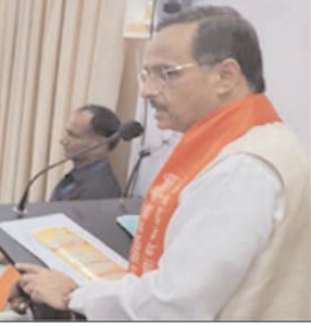
प्रशिक्षण दिया जाना आवश्यक है। उन्होंने कहा कि अस्थायी समाज सही मायने मे राष्ट्र निर्माण के लिए युवा तैयार कर रही है। आर्य समाज के 300

लखनऊ। उत्तर प्रदेश के पूर्व उपमुख्यमंत्री डा दिनेश शर्मा ने कहा कि राष्ट्र निर्माण के लिए युवाओं को जीवन में बेहतर प्रशिक्षण दिया जाना जरूरी है। अगर उन्हें सही दिशा नहीं दिखाई जाएगी तो वे भटक सकते हैं। डा शर्मा ने सोमवार को आर्यवीर दल के प्रशिक्षण सत्र का उदघाटन करते हुये कहा कि अगर कश्मीर जो युवा आतंकी गतिविधियों में लिप्त है उन्हें असल में गोली चलाने को प्रशिक्षण मिला है उसका वह नकारात्मक प्रयोग कर रहे हैं। ऐसा नहीं हो इसलिए समाज के युवाओं को सही और सकारात्मक