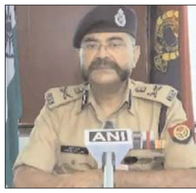
अग्निपथ योजना के विरोध में प्रदेश में हुई हिंसक घटनाओं के मामले में अब तक 39 केस दर्ज किए गए हैं। इसके

लखनऊ। सेना में भर्ती के लिए केंद्र सरकार की अग्निपथ योजना के विरोध में कुछ संगठनों के भारत बंद के आवाहन का उत्तर प्रदेश में कोई असर नहीं दिखा है। हालांकि कुछ जगहों पर युवाओं का विरोध प्रदर्शन देखने को मिला लेकिन वो भी पुलिस को देखकर भाग खड़े हुए। यूपी में अग्निपथ के विरोध में हुई हिंसक घटनाओं के मामले में अब तक कुल 475 लोगों को गिरफ्तार किया गया है जबकि कुल 39 मुकदमे दर्ज किए गए