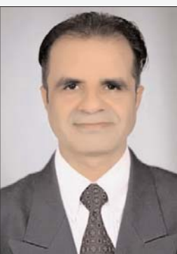
गोंदिया - वैश्विक स्तर पर भारत

दुनिया का सबसे बड़ा लोकतंत्र के रूप में विख्यात है,जिसकी अनेक देशों में मिसालें दी जाती है कि हर विषय व बिल पर खुलकर चर्चा कर आम सहमति बनाते हुए विषयों का व कानूनों की गुणवत्ता को निखारा जा सके, जिसका सटीक उदाहरण हमारा आज का संविधान है, जिसकी संविधान सभा की बहस दिसेंबर 1946 से जनवरी 1950 तक चली थी उस कवायद का मकसद या आदेश रूप में संसदीय बहस की परंपरा बहाल रखते हुए उसे मजबूती दी जाए।सांसदों के लिएविवेकसम्मत तरीके से मतदान की इजाजत हो ताकि विमर्श की अपेक्षित प्रक्रिया पुनर्जीवित हो।ब्रिटिश में पीएमको हर बुधवार को हाउस आफ कॉमन्स में सांसदों के प्रश्नों का जवाब देना होता है विपत्ति अवधि कोविड-19 के दौरान भी पीएम ने वर्चुअली सांसदों के सवालों का जवाब देना देना पड़ा था जबकि भारत में उस अवधि में