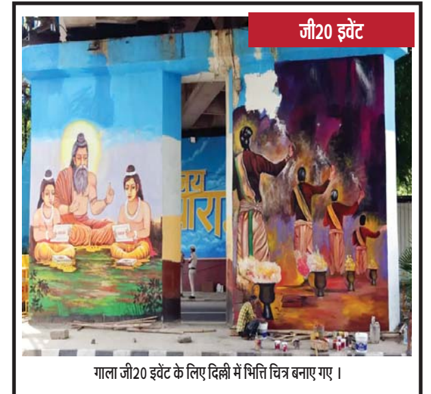
गाला जी20 इवेंट के लिए दिल्ली में भिंति चित्र बनाए गए।