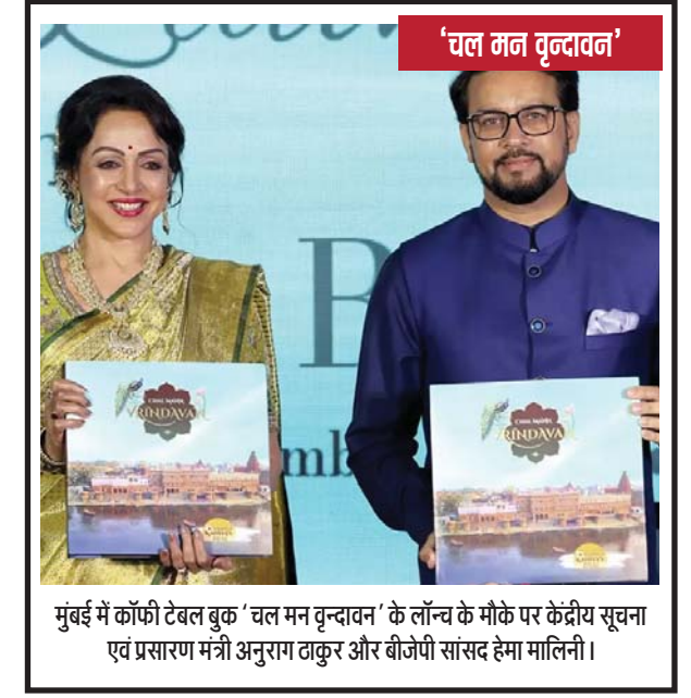
मुंबई में कांफ़ी टेबल बुक 'चल मन वन्दवान' के लॉन्च के मौके पर केंद्रीय सूचना एवं प्रसारण मंत्री अनुराग ठाकुर और बीजेपी सांसद हेमा मालिनी।

नई दिल्ली। छह महीने से कम समय के लिए ब्रिटेन जाने वाले विजिटर्स को अब वीजा फीस के रूप में 15 पाउंड और स्टूडेंट्स को 127 पाउंड ज्यादा देने होंगे। ब्रिटिश सरकार ने ऐलान किया है कि वीजा शुल्क में प्रस्तावित बढ़ोतरी चार अक्टूबर से लागू हो जाएगी। शुक्रवार को ब्रिटेन की संसद में यह विधेयक पेश किया गया। ब्रिटेन के गृह विभाग ने कहा कि बढ़ोतरी के बाद ब्रिटेन आने वाले विजिटर्स को वीजा शुल्क के रूप में 115 पाउंड देने होंगे और छात्रों को 490 पाउंड देने होंगे।