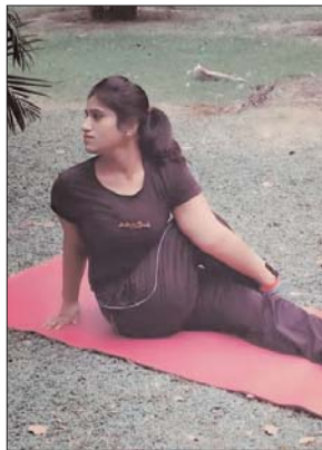
इन तीन योगासन की मदद ले सकते हैं। बच्चों की हाइट बढ़ाने के लिए करें ये योगासन

योगासन केवल शारीरिक विकास के लिए ही नहीं होते हैं, बल्कि उनका मानसिक और आध्यात्मिक असर भी होता है। यह शारीरिक कठों से से राहत दिलाता है तो वहीं मानसिक दबाव को कम करता है। बच्चों की हाइट न बढ़ना आजकल आम समस्या हो गई है। अगर अच्छे खानपान और कई तरह की एक्सरसाइज करने के बावजूद किसी बच्चे की लम्बाई नहीं बढ़ रही है तो ऐसे में पेरेंट्स का चिंता करना लाजमी है। शुरूआत में बच्चों की लम्बाई पर माता-पिता ध्यान नहीं देते हैं लेकिन जब 15 साल के बाद भी उम्र के हिसाब से बच्चे की लम्बाई नहीं बढ़ती है तो उन्हें चिंता होने लगती है। अगर हर तरह के उपाय करने के बावजूद आप बच्चे को हाइट नहीं बढ़ रही है तो आप