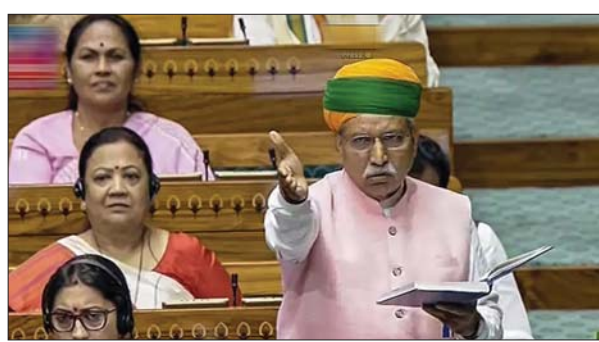
चुनावों से लागू हो सकता है।

नई दिल्ली। लोकसभा में आज 19 सितंबर को 128वां संविधान संशोधन बिल यानी नारी शक्ति वंदन विधेयक पेश किया गया। इसके मुताबिक लोकसभा और राज्यों की विधानसभाओं में महिलाओं के लिए 33 प्रतिशत रिजर्वेशन लागू किया जाएगा। लोकसभा की 543 सीटों में 181 महिलाओं के लिए आरक्षित होंगी। लोकसभा में इस बिल पर कल 20 सितंबर को सुबह 11 बजे से शाम 6 बजे तक बहस होगी।