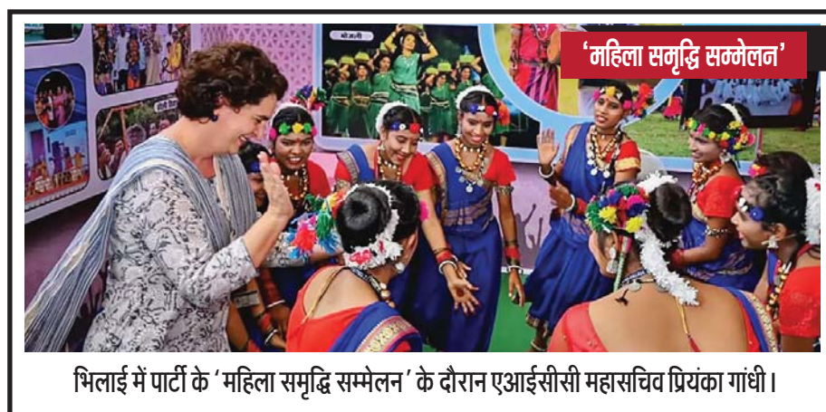
भिलाई में पार्टी के 'महिला समृद्धि सम्मेलन' के दौरान एआईसीसी महासचिव प्रियंका गांधी।

उनके पीड़ितों को भी मुआवजा दिया जाएगा। रेलवे बोर्ड ने 18 सितंबर 2023 को एक सर्कुलर जारी करके मुआवजा राशि बढ़ाने की जानकारी दी थी। अब इसे लागू कर दिया गया है। ये नियम 18 सितंबर से लागू कर दिए गए हैं। इससे पहले 2012-2013 में इस राशि में संशोधन किया गया था।