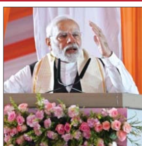
इस बार कई गुना बढ़ गया है नवरात्रि का उत्साह

वाराणसी। प्रधानमंत्री नरेंद्र मोदी ने कहा है कि माताओं और बहनों की शक्ति ही उनका सबसे बड़ा सुरक्षा कवच है। पीएम मोदी ने वाराणसी के संपूर्णानंद मैदान में आयोजित नारी शक्ति वंदन अभिनंदन कार्यक्रम के दौरान विपक्ष को इस बात के लिए आड़े हाथ लिया कि तीन दशक तक इस बिल को लटकाकर रखा गया। उन्होंने कहा कि साढ़े नौ सालों और बहनों की एकजुटता और उनकी ताकत के कारण आज राजनीतिक पार्टियां कांप रही हैं। इस दौरान मुख्यमंत्री योगी आदित्यनाथ ने संसद में नारी शक्ति वंदन अधिनियम पास होने पर प्रदेश की मातृशक्ति की ओर से प्रधानमंत्री का आभार प्रकट किया। उन्होंने कहा कि बीते साढ़े नौ सालों में माताओं और बहनों को केंद्र में रखकर सरकार ने काम किया है। इस अवसर पर विभिन्न योजनाओं की लाभार्थी महिला समूहों ने प्रधानमंत्री का स्वागत किया।