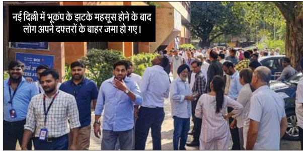
नई दिल्ली में भूकंप के झटके महसूस होने के बाद लोग अपने दफतरो के बाहर जमा हो गए।

नेपाल में एक घंटे में चार भूकंप आए। राष्ट्रीय भूकंप विज्ञान केंद्र के एक अधिकारी ने कहा कि 4.6 तीव्रता का पहला भूकंप दोपहर 2: 25 बजे पश्चिम नेपाल में 10 किलोमीटर की