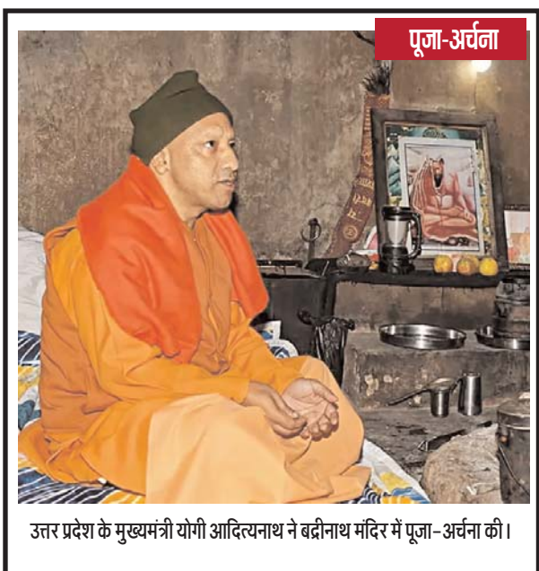
उत्तर प्रदेश के मुख्यमंत्री योगी आदित्यनाथ ने बदीनाथ मंदिर में पूजा-अर्चना की।

राहुल और विराट की अघेरातकीय पारी, भारत ने ऑस्ट्रेलिया को छह विकेट से .... पेज 07