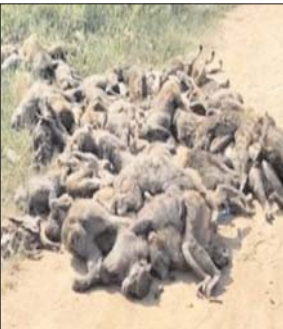
महबूबाबाद जिले में करीब 40 बंदरों