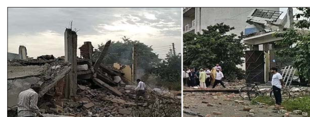
सही। विस्फोट क्यों हुआ? इनकी जांच की जा रही है। सीएम योगी ने लिया घटना का संज्ञान लिया है। जांच कर रिपोर्ट तैयार करने के लिए छर्रूसिटी के निर्देशन में 6 सदस्यीय जांच टीम बनाई गई है।

मेरठ। मेरठ में मंगलवार सुबह साबुन फैक्ट्री में बम धमाके जैसे 2 विस्फोट हुए। ये धमाके 30 मिनट के अंदर हुए। इसमें 5 लोगों की मौत हो गई। 10 मजदूर मलबे में दब गए। कई की हालत गंभीर है। ब्लास्ट इतना तेज था कि दो मॉजिला फैक्ट्री ताश के पत्तों की तरह धराशायी हो गई। आसपास के 4 मकान क्षतिग्रस्त हो गए। पूरे इलाके में धुएं का गुबार छा गया। मौके से आतिशबाजी और उसे बनाने का सामान मिला है। मालिक फरार है। डीएम, एसएसपी समेत सीनियर अफसर मौके पर जांच कर रहे हैं। एटीएस भी मौके पर पहुंची है। शहर के लोहिया नगर में बिल्डिंग में साबुन फैक्ट्री है। मंगलवार सुबह यहां 14 मजदूर काम कर रहे थे। विस्फोट की सूचना पर पहुंची पुलिस, फायर ब्रिगेड की टीम और आस-पास के लोगों ने मलबे में दबे लोगों को निकालना शुरू किया। विस्फोट इतना भयावह था कि कई मजदूर कई मीटर दूर जाकर गिरे। उनका पूरा शरीर जल गया था। झुंसी हुई लाशों भी इधर-उधर बिखरी थीं। साबुन फैक्ट्री में बड़ी संख्या में आतिशबाजी, प्लास्टिक शिल्स मिले हैं। आशंका है कि आतिशबाजी के चलते ही पूरा विस्फोट हुआ है। छर्रू दाल की मीणा ने बताया कि 10 लोग घायल हैं। छर्रू दाल की टीम में मौके पर रेस्क्यू कर रही है। फैक्ट्री अवैध थी या