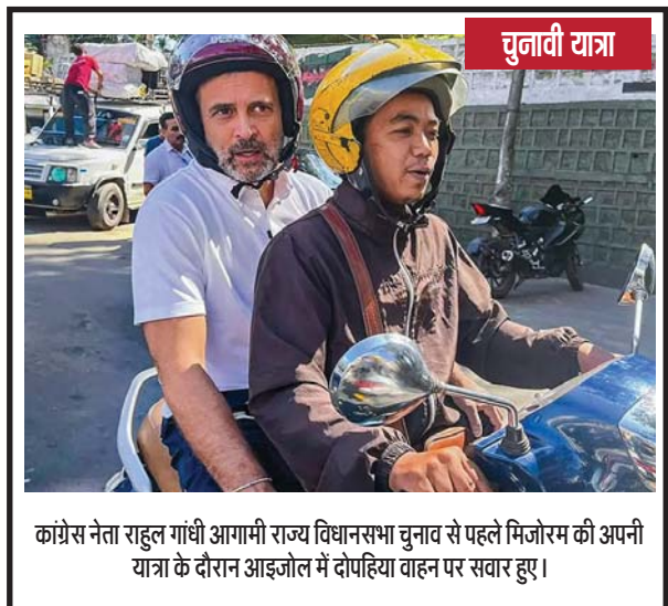
कांग्रेस नेता राहुल गांधी आगामी राज्य विधानसभा चुनाव से पहले मिजोरम की अपनी यात्रा के दौरान आइजॉल में दोपहिया वाहन पर सवार हुए।

सफलताओं की नींव पर अब देश को नये महत्वाकांक्षी लक्ष्य निर्धारित करने चाहिए, उन्होंने इसी संदर्भ में 2035 तक भारतीय अंतरिक्ष स्टेशन और 2040 तक चंद्रमा पर भारत का पहला मानव भेजने का लक्ष्य रखा।