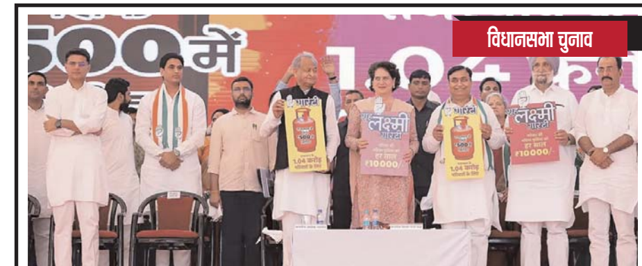
झुंझुनू जिले में आगामी राज्य विधानसभा चुनाव से पहले एक सार्वजनिक बैठक के दौरान राजस्थान के मुख्यमंत्री अशोक गहलोत कांग्रेस नेताओं प्रियंका गांधी वादा, सचिन पायलट, सुखजिंदर सिंह रंधावा और अन्य के साथ।

नयी दिल्ली। प्रधानमंत्री नरेन्द्र मोदी गुरुवार को महाराष्ट्र और गोवा का दौरा करेंगे। प्रधानमंत्री दोपहर महाराष्ट्र में अहमदनगर जिले के शिरडी पहुंचेंगे, जहां वह श्री साईबाबा समाधि मंदिर में पूजा और दर्शन करेंगे। वह मंदिर में नए दर्शन परिसर का भी उद्घाटन करेंगे। बाद में प्रधानमंत्री निलंबंडे बांध का जल पूजन करेंगे और बांध के एक नहर नेटवर्क को राष्ट्र को समर्पित करेंगे।