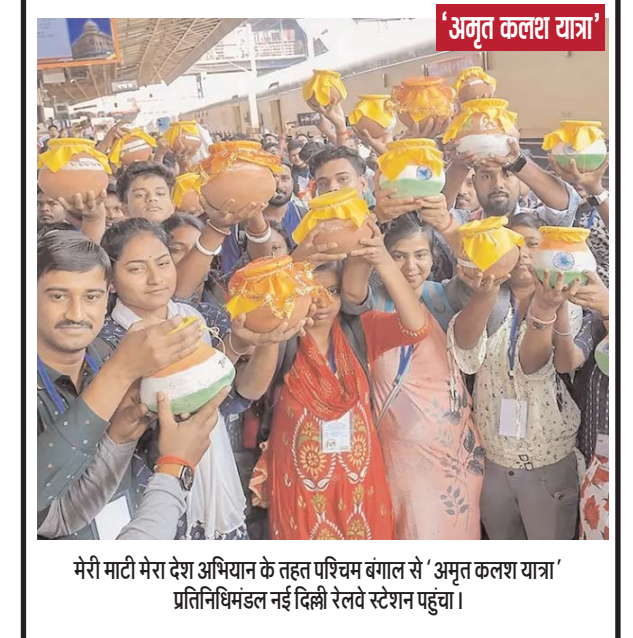
मेरी माटी मेरा देश अभियान के तहत पश्चिम बंगाल से 'अमृत कलश यात्रा' प्रतिनिधिमंडल नई दिल्ली रेलवे स्टेशन पहुंचा।

विशेषज्ञों के मुताबिक मौसम में बदलाव और हवा की गति कम होने और हवा में सराली का धुआं घुलने से दीपावली से पहले ही हवा बेहद खराब श्रेणी में पहुंच गई है। बता दें दिल्ली में ग्रेटर नोएडा का एक्यूआई 344 दर्ज किया गया है। वहीं, फरीदाबाद में 309, गाजियाबाद में 286, नोएडा में 281 व गुरुग्राम में 198 एक्यूआई दर्ज किया गया।