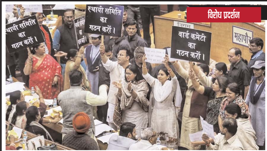
नई दिल्ली के सिविक सेंटर में स्थायी समिति और वार्ड समिति के गठन की मांग को लेकर तख्तियां लेकर भाजपा पार्षदों ने विरोध प्रदर्शन किया।