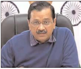
नहीं जारी किए जा रहे हैं, उसकी वजह से दिल्ली में पानी और सीवर को समस्या पैदा होने की संभावना बढ़ गई है।

नई दिल्ली। सीएम अरविंद केजरीवाल ने बुधवार को दिल्ली जल बोर्ड का सीएजी से स्पेशल ऑडिट को लेकर एक बड़ा फैसला लिया है। सीएम ने दिल्ली जल बोर्ड का सीएजी से स्पेशल ऑडिट कराने का आदेश दिया है। सीएजी दिल्ली जल बोर्ड के पिछले 15 साल के कामकाज का ऑडिट करेगा। इसका उद्देश्य डीजेबी में पारदर्शिता लाना है। साथ ही, विपक्ष की ओर से डीजेबी पर सरकारी धन का दुरुपयोग करने के लगाए जा रहे आरोपों की सच्चाई भी दिल्ली की जनता के सामने आ जाएगी।