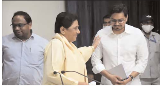
किया। मीटिंग में पार्टी के 28 राज्यों के पदाधिकारी मौजूद थे।

लखनऊ। बसपा सुप्रीमो मायावती (67) ने अपने भतीजे आकाश आनंद (27) को अपना उत्तराधिकारी घोषित किया है। यानी मायावती के बाद पार्टी की कमान आकाश के हाथों में होगी। अभी यूपी और उत्तराखंड में पार्टी की जिम्मेदारी मायावती संभालेंगी, जबकि बाकी 26 राज्यों को आकाश देखेंगे। पार्टी की विरासत और राजनीति को आगे बढ़ाने के लिए मायावती ने अपने भतीजे को आगे किया है। रविवार 10 दिसंबर को डेढ़ घंटे चली मीटिंग के बाद मायावती ने इस फैसले का ऐलान