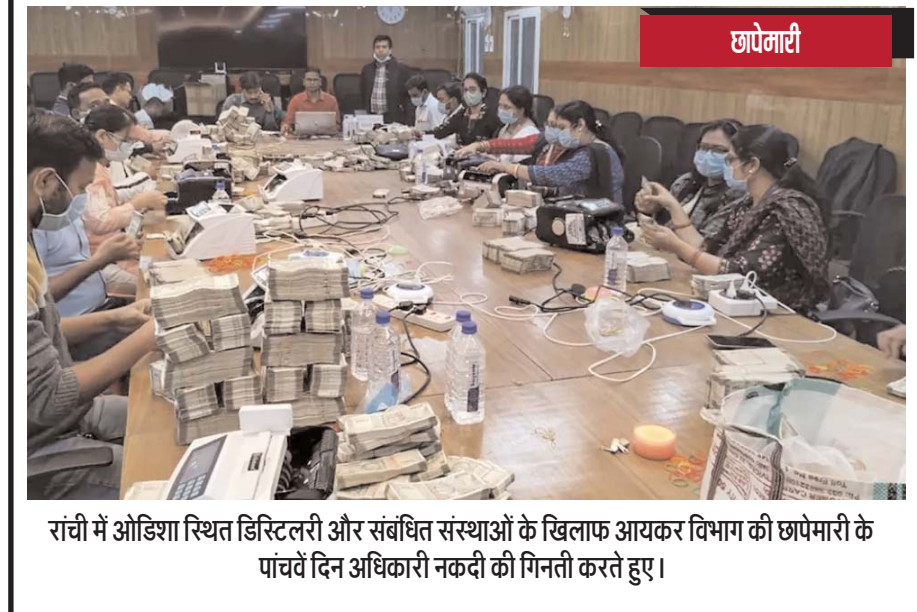
रांची में ओडिशा स्थित डिस्ट्रिब्यूशन और संबंधित संस्थाओं के खिलाफ आयकर विभाग की छापेमारी के पांचवें दिन अधिकारी नकदी की गिनती करते हुए।

गांधीनगर। प्रधानमंत्री नरेंद्र मोदी ने आभासी माध्यम से शनिवार को कहा कि हम गिफ्ट सिटी को उन्नत वैश्विक क्वालिटी प्रौद्योगिकी सेवा का वैश्विक केन्द्र बनाना चाहते हैं। मोदी ने आज आभासी माध्यम से फिटनेक पर वैश्विक विचार के लिए लीडरशिप प्लेटफॉर्म इन्फिनिटी फोरम के द्वितीय एडिशन को संबोधित किया। द्वितीय इन्फिनिटी फोरम का आयोजन इंटरनेशनल फाइनेंशियल सर्विसेज सेंटर्स ऑफ ऑथोरिटी (आईएफएससी) तथा भारत सरकार के संयुक्त तत्त्वधान में गांधीनगर स्थित गिफ्ट सिटी में किया गया। यह वाइब्रेंट गुजरात ग्लोबल समिट 2024 का प्री-इवेंट सम्मेलन था। इस इन्फिनिटी फोरम का विषय 'गिफ्ट-आईएफएससी-उन्नत वैश्विक क्वालिटी सेवाओं के लिए मुख्य केन्द्र' था। उन्होंने सम्मेलन को संबोधित करते हुए दिसंबर 2021 में इन्फिनिटी फोरम के प्रथम एडिशन के आयोजन के दौरान महामारी के कारण वैश्विक आर्थिक स्थिति की अनिश्चितता का सामना करने वाली दुनिया को याद किया। उन्होंने ज़ोर देकर कहा कि अभी भी इस चिंताजनक स्थिति का पूरी तरह समाधान नहीं हुआ है। उन्होंने भू-राजनीतिक तनावों, ऊँची महंगाई एवं क्वालिटी के स्तर की चुनौतियों का उल्लेख करते हुए मजबूती तथा प्रगति के प्रतीक के रूप में भारत के विकास की बात कही।