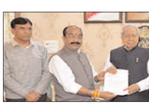
सरकार बनाने के लिए अपना दावा प्रस्तुत किया। हरिचंदन ने श्रीसाय को नेता चुने जाने पर बधाई एवं शुभकामनाएं दीं। उन्होंने संविधान की धारा 164 के तहत श्री साय को मुख्यमंत्री नियुक्त करने संबंधित पत्र प्रदान किया और कैबिनेट गठन के

रायपुर। छत्तीसगढ़ के राज्यपाल विश्वभूषण हरिचंदन ने भाजपा विधायक दल के नेता चुने गए विष्णुदेव साय को मुख्यमंत्री मनोनीत करते हुए उन्हें शपथ ग्रहण के लिए आमंत्रित किया है। राज्यपाल हरिचंदन से इससे पूर्व आज यहां राजभवन में छत्तीसगढ़ राज्य भाजपा के अध्यक्ष अरूण साव ने पार्टी नेताओं के साथ मिलकर भाजपा के नव निर्वाचित विधायकों द्वारा सर्वसम्मति से श्री साय को प्रदेश विधायक दल का नेता चुने जाने सम्बन्धी पत्र सौंपा और नई