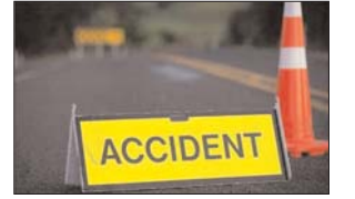
दिया। पुलिस ने कहा कि तीन छात्रों की घटनास्थल पर ही मौत हो गई और एक अन्य छात्र को गंभीर हालत में अस्पताल में भर्ती किया गया जहां इलाज के दौरान उसकी मौत हो गई। पुलिस ने कहा कि मामला दर्ज कर लिया गया है और जांच चल रही है।

चिक्कबल्लपुर। कर्नाटक के चिक्कबल्लपुर कोलेज के चार छात्रों की कार दुर्घटना में मौत हो गई जब उनकी कार अनियंत्रित होकर खाई में गिर गई। पुलिस के अनुसार, यह दुर्घटना शनिवार रात उस समय हुई जब मृतक अपने कोलेज के दो दोस्तों को विदा कराने के लिए बेंगलुरु से चिक्कबल्लपुर जा रहे थे। उन्होंने कहा कि यह दुर्घटना तब हुई जब कार चला रहे छात्र ने तेज गति के कारण कार पर अपना नियंत्रण खो