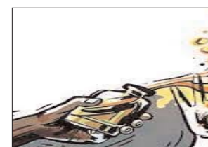
दिल्ली में 7 बार हमले का प्रयास एनसीआरबी डेटा से पता चला है कि दिल्ली में पिछले साल सबसे ज्यादा 7 बार एसिड हमले का प्रयास भी किया गया था। इसके बाद बेंगलुरु में पिछले साल ऐसे 3 मामले दर्ज किए गए। इस बीच, हैदराबाद और अहमदाबाद में 2022 में हमले के प्रयास के दो-दो

नई दिल्ली। नेशनल क्राइम रिकॉर्ड्स ब्यूरो की तरफ से जारी नई रिपोर्ट के मुताबिक, देश में पिछले साल सबसे ज्यादा एसिड हमलों की शिकार बेंगलुरु की महिलाएं हुईं। 2022 में बेंगलुरु में सबसे ज्यादा 6 एसिड अटैक हुए। जिसमें से पुलिस ने छह मामले दर्ज किए। इस लिस्ट में दूसरा नाम दिल्ली का है। जहां पांच महिलाएं इसका शिकार हुईं। आंकड़ों के मुताबिक, एनसीआरबी ने करीब 19 बड़े शहरों की लिस्ट जारी की है। बेंगलुरु, दिल्ली के बाद तीसरे नंबर पर अहमदाबाद रहा, जहां ऐसे पांच मामले दर्ज किए गए।