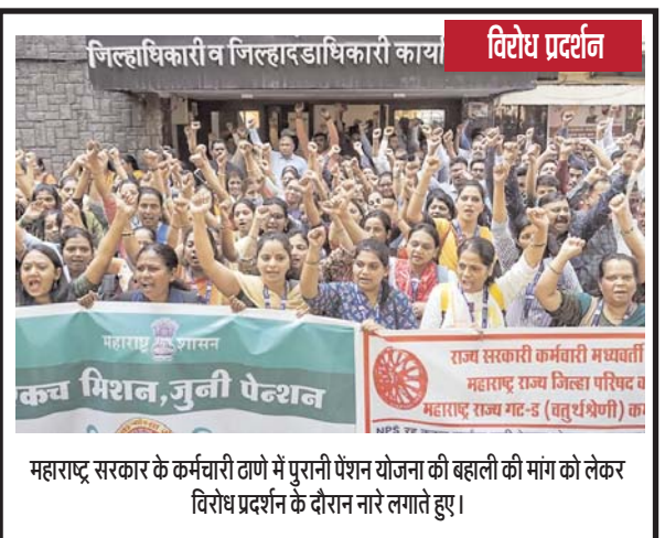
जिल्हाधिकारी व जिल्हादंडाधिकारी का विरोध प्रदर्शन

टैगोर, एमडी जावेद, वीके श्रीकंदन और बेनी बेहनना का नाम शामिल है। राज्यसभा से TMC सांसद डेरेक ओब्रायन को सस्पेंड किया गया है। दरअसल, डेरेक नारेबाजी करते हुए वेल में आ गए थे, जिससे नाराज होकर स्पीकर जगदीप धनखड़ ने उन्हें सदन से बाहर जाने को कहा और कार्यवाही