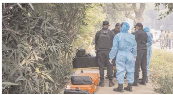
उधर, पुलिस को एम्बेसी के पास का एक सीसीटीवी फुटेज मिला है। एजेंसी

नई दिल्ली। दिल्ली के चाणक्यपुरी स्थित इजराइली एम्बेसी के पास लो इंटेंसिटी के धमाके मामले में बुधवार को एनआईए एक्टिव हो गई है। एनआईए ने इजराइली एम्बेसी पहुंचकर सबूत जुटाए। इसके अलावा एनएसजी के जवान भी फॉरेंसिक एक्सपर्ट के साथ इजराइली एम्बेसी पहुंचे। जांच के दौरान पता चला है कि धमाका एम्बेसी से 260 मीटर नंदास हाउस के गेट नंबर -4 पर हुआ था और इस जगह पर कोई सीसीटीवी कैमरा नहीं लगा था।