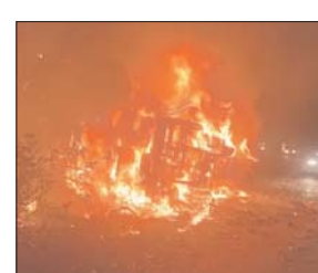
मौके पर पुलिस और प्रशासन के अधिकारी पहुंच गए और फंसे लोगों को निकाला। बजरंगगढ़ थाने के

गुना। मध्यप्रदेश के गुना में यात्री बस में आग लगने से 5 लोग जिंदा जल गए। जबकि 14 लोग घायल हो गए। जिन्हें जिला अस्पताल भेजा गया है। हादसा बुधवार रात करीब साढ़े 8 बजे हुआ। बस गुना से आरोन तरफ जा रही थी। तभी एक डंपर से बस की टक्कर हो गई। टक्कर लगते ही बस पलट गई और उसमें आग लग गई। फिलहाल बस में लगी आग पर काबू पा लिया गया है। हादसे की सूचना मिलते ही