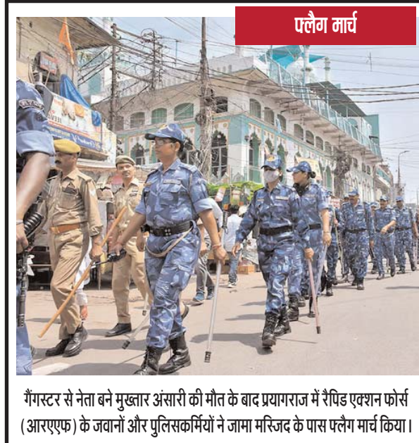
गैंगर से नेता बने मुख्तार अंसारी की मौत के बाद प्रयागराज में रैपिड एक्शन फोर्स (आरएफ) के जवानों और पुलिसकर्मियों ने जामा मस्जिद के पास एलैंग मार्च किया।

है। उन्होंने कहा कि जिस मापदंडों के आधार पर कांग्रेस को जुमनि के नोटिस दिए गए हैं, उन्हीं के आधार पर भाजपा से 4600 करोड़ रुपए की वसूली करनी चाहिए। 2017-18 में हमारे 14 लाख रुपए के वॉयलेशन के ऊपर भाजपा के इनकम टैक्स डिपार्टमेंट ने 135 करोड़ रुपए कांग्रेस के बैंक खाते से छीनकर ले गए। 2017-18 में ही भाजपा को 1 हजार 297 लोगों ने करीब 42 करोड़ रुपए का चंदा दिया।