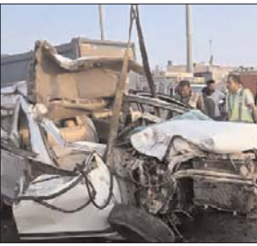
मेरठ-दिल्ली एक्सप्रेस-वे पर हादसा

गाजियाबाद। मेरठ-दिल्ली एक्सप्रेस-वे पर गुरुवार सवेरे बड़ा हादसा हो गया। स्कूली वैन एक डंपर से जा भिड़ी। पीछे से आ रही एक तीसरी गाड़ी भी इन दोनों से टकराकर पलट गई। इस हादसे में स्कूली वैन के ड्राइवर और एक बच्चे की मौत हो गई। 10 बच्चे घायल हैं। इन्हें चार अस्पतालों में भर्ती कराया गया है।