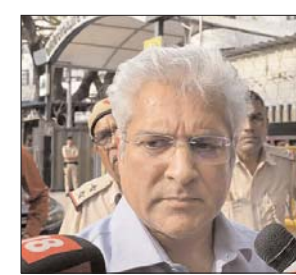
बुलाया था। गहलोत से धन शोधन निवारण अधिनियम के तहत अपना बयान दर्ज कराने के लिए कहा है।

ईडी ने शनिवार सुबह ही गहलोत को समन जारी किया था और उन्हें तत्काल पूछताछ के लिए अपने दफ्तर