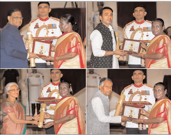
भारत रत्न सम्मान देने का ऐलान किया था

2014 में सत्ता संभालने के बाद से मोदी के कार्यकाल में मदन मोहन मालवीय, अटल बिहारी वाजपेयी, प्रणव मुखर्जी, भूपेन हजारिका और नानाजी देशमुख को यह सम्मान मिल चुका है।