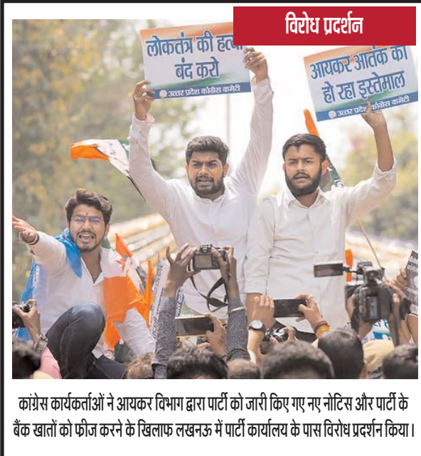
कांग्रेस कार्यकर्ताओं ने आयकर विभाग द्वारा पार्टी को जारी किए गए नए नोटिस और पार्टी के बैंक खातों को फ्रीज करने के खिलाफ लखनऊ में पार्टी कार्यालय के पास विरोध प्रदर्शन किया।