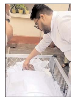
परिवार के लोगों को ही कब्रिस्तान में

जनाजा निकलने के बाद प्रिंस टाकीज मैदान पर नमाज-ए-जनाजा की रस्म अदा की गई। वहीं लोगों से अपील की गई कि अब आगे ना जाएं,