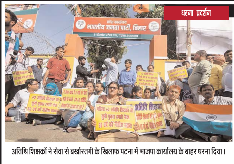
अतिथि शिक्षकों ने सेवा से बर्खास्तगी के खिलाफ पटना में भाजपा कार्यालय के बाहर धरना दिया।