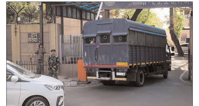
नई दिल्ली में दिल्ली शराब नीति से संबंधित मनी लॉन्ड्रिंग मामले में एक अदालत द्वारा 15 अप्रैल तक न्यायिक हिरासत में भेजे जाने के बाद दिल्ली के मुख्यमंत्री अरविंद केजरीवाल को तिहाड़ जेल भेजा गया।

नई दिल्ली। दिल्ली की शराब आबकारी नीति केस में सोमवार को सीएम अरविंद केजरीवाल को 15 अप्रैल तक के लिए तिहाड़ जेल भेज दिया गया। वे जेल नंबर 2 में अकेले रहेंगे। 121 मार्च से जेल में बंद दिल्ली के मुख्यमंत्री अरविंद केजरीवाल से जुड़े दो मामलों पर राउज एवेन्यू कोर्ट और दिल्ली हाईकोर्ट में सुनवाई हुई।