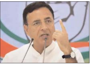
सुरजेवाला की टिप्पणी की कड़ी निंदा करता है। आयोग ने कहा कि यह बयान

नयी दिल्ली। राष्ट्रीय महिला आयोग ने कांग्रेस नेता रणदीप सिंह सुरजेवाला को मथुरा से लोकसभा सांसद एवं भारतीय जनता पार्टी की नेता हेमा मालिनी पर आपत्तिजनक टिप्पणी करने के लिए चुनाव आयोग को पत्र लिखा है। आयोग ने गुरुवार को सोशल मीडिया पर जारी एक पोस्ट में कहा कि आयोग सांसद हेमा मालिनी पर श्री