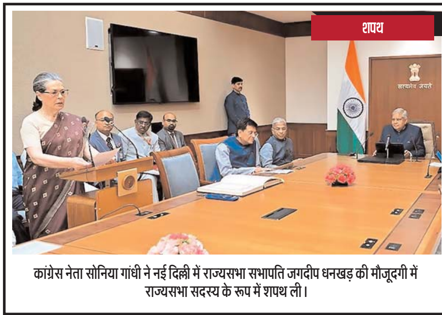
कांग्रेस नेता सोनिया गांधी ने नई दिल्ली में राज्यसभा सभापति जगदीप धनखड़ की मौजूदगी में राज्यसभा सदस्य के रूप में शपथ ली।