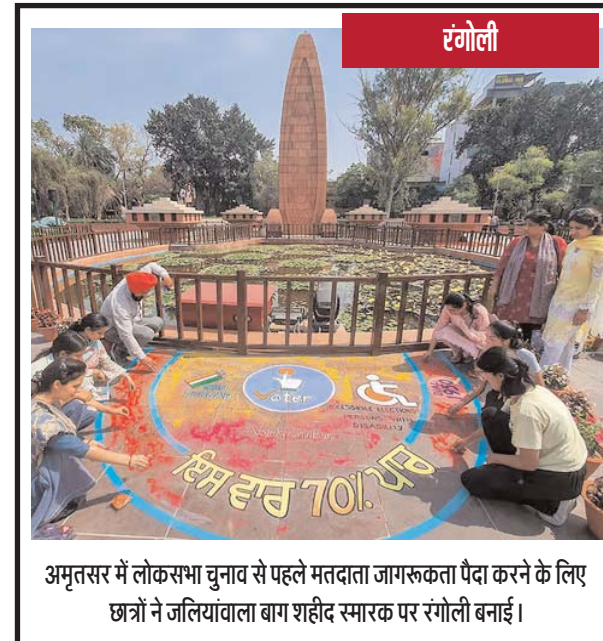
अमृतसर में लोकसभा चुनाव से पहले मतदाता जागरूकता पैदा करने के लिए छात्रों ने जलियावाला बाग शहीद स्मारक पर रंगोली बनाई।