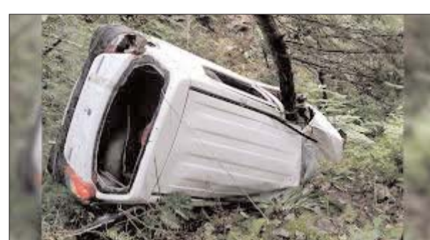
उधर, घटना की सूचना मिलते ही पुलिस टीम मौके पर पहुंची और रेस्क्यू करने में जुट गई।

शिमला। हिमाचल प्रदेश में सड़क हादसे के ताजा घटनाक्रम में कुल्लू जिला में एक सड़क हादसे में चार लोगों की दर्दनाक मौत हो गई। पुलिस ने शुक्रवार को यह जानकारी दी।