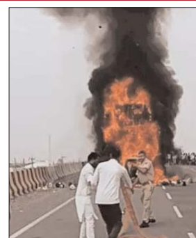
का रहने वाला था।

फतेहपुर। राजस्थान के चूरू सालासर स्टेट हाईवे पर एक्सिडेंट के बाद 7 लोग कार में ही जिंदा जल गए। सालासर बालाजी से दर्शन करके लौट रहे परिवार की तेज रफ्तार कार ट्रक में घुस गई थी, टक्कर के बाद दोनों वाहनों में आग लग गई। मृतक परिवार उत्तर प्रदेश के मेरठ