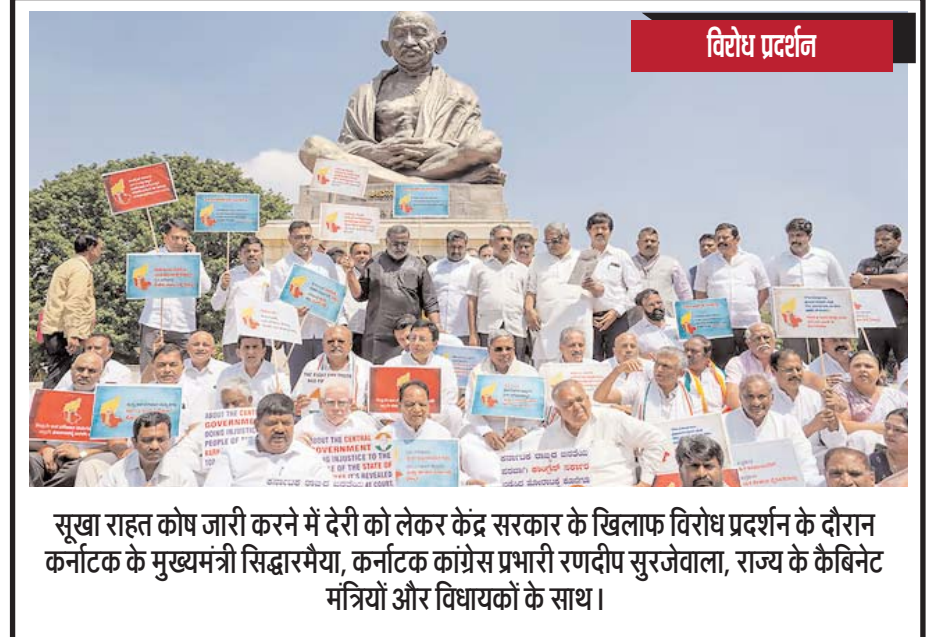
सूखा राहत कोष जारी करने में देरी को लेकर केंद्र सरकार के खिलाफ विरोध प्रदर्शन के दौरान कर्नाटक के मुख्यमंत्री सिद्धारमैया, कर्नाटक कांग्रेस प्रभारी रणदीप सुरजेवाला, राज्य के कैबिनेट मंत्रियों और विधायकों के साथ।

चुनाव के लिये कुल दो हजार 963 नामांकन पत्र दाखिल किए गए थे। इस चरण के लिये पत्र दाखिल करने की अंतिम तिथि 19 अप्रैल थी और नामांकन पत्रों की जांच के बाद 1,563 पत्र वैध पाये गये थे। तीसरे चरण के चुनाव में गुजरात में 26 संसदीय सीटों के लिये कुल 658 नामांकन पत्र मिले थे, उसके बाद महाराष्ट्र की 11 सीटों से लिए 519, कर्नाटक में 14 सीटों के लिए 503, छत्तीसगढ़ की सात सीटों के लिये 319 और उत्तर प्रदेश की 10 सीटों के लिये 271 नामांकन पत्र आये थे।