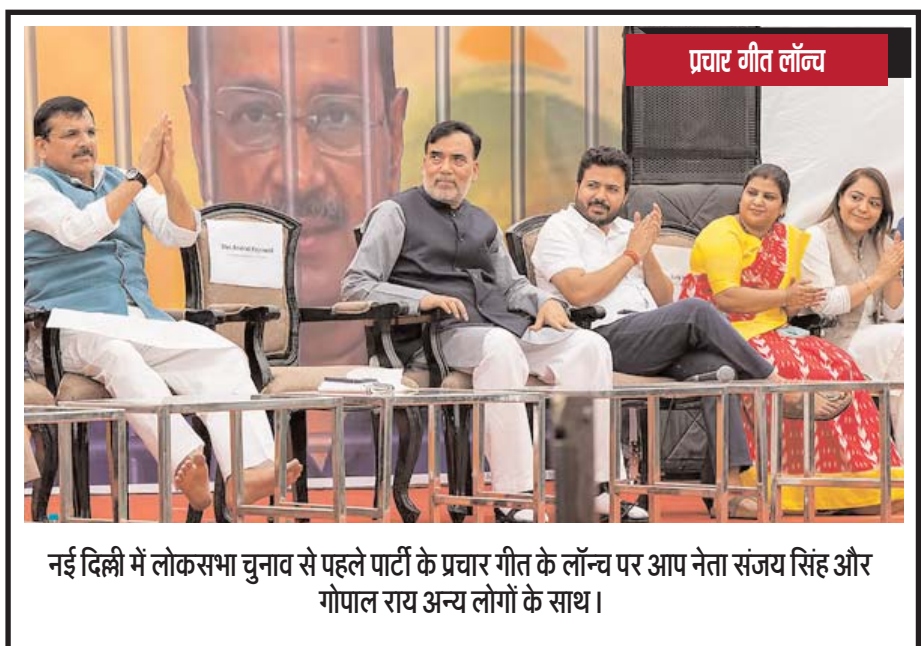
प्रचार गीत लॉन्च