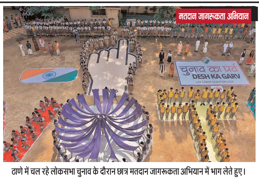
टाणों में चल रहे लोकसभा चुनाव के दौरान छत्र मतदान जागरूकता अभियान में भाग लेते हुए।