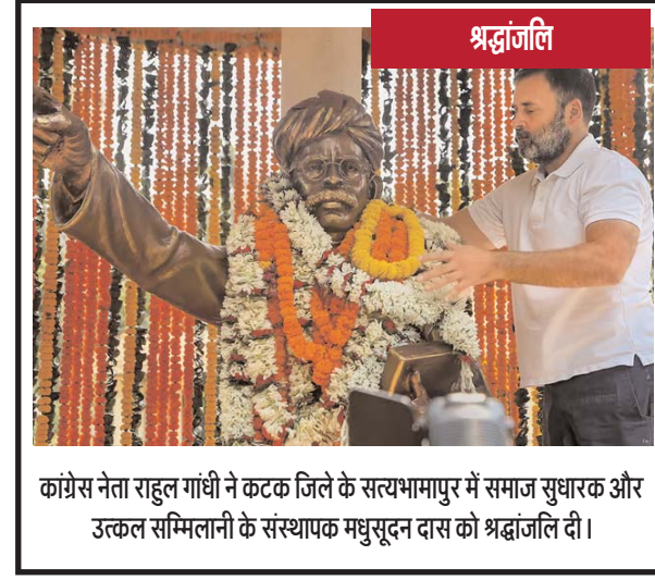
कांग्रेस नेता राहुल गांधी ने कटक जिले के सत्यभामापुर में समाज सुधारक और उत्कल सम्मिलानी के संस्थापक मधुसूदन दास को श्रद्धांजलि दी।

ऑपरेशन चला रही थीं। इंडियन कोस्ट गार्ड ने बताया कि सूचना मिलने के बाद इस नाव की तलाश में रात भर ऑपरेशन चलाया गया था। गया।